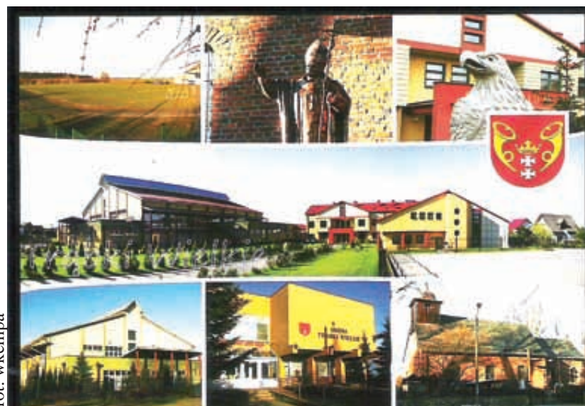
Kartka opracowana przez młodzież

Organizatorem konkursu był GOKSiR w Trąbkach Wielkich i Szkoła Podstawowa w Czerniewie. Oprac. DK