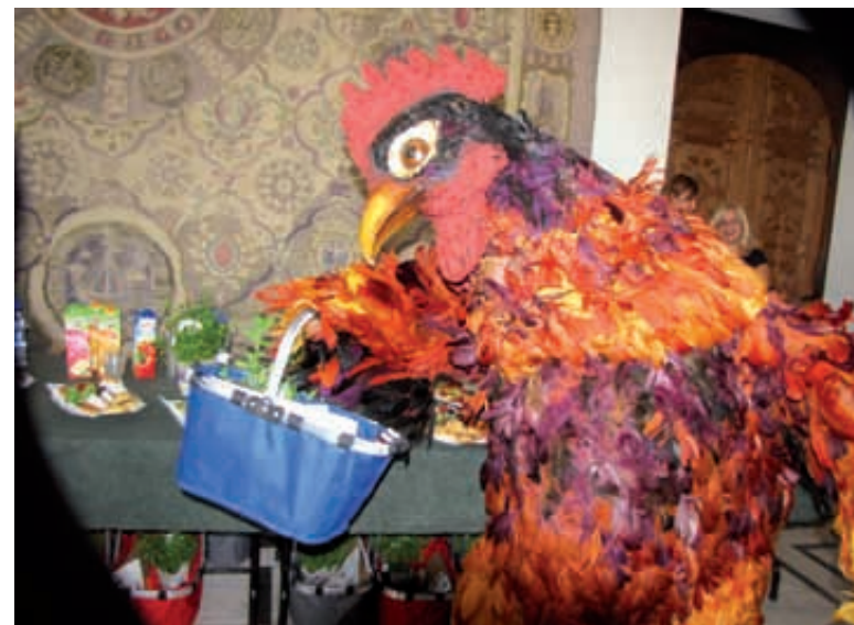
Jarmarkowy kogut z koszem pełnym przysmaków

nych miast całego niemal świata - teraz będzie miał je również Gdańsk. Jeszcze nie jako stały element grodu nad Motławą, ale dzięki Jarmarkowi św. Dominika już w lipcu stało na Wyspie Spichrzów potężne koło widokowe. To nim, w jednej z 42 ośmioosobowych kabin, będzie można wznieść się na wysokość 55 metrów i z niepowtarzalnej perspektywy zobaczyć Gdańsk oraz Zatokę Gdańską. Kabinę są zamykane, co gwarantuje bez-