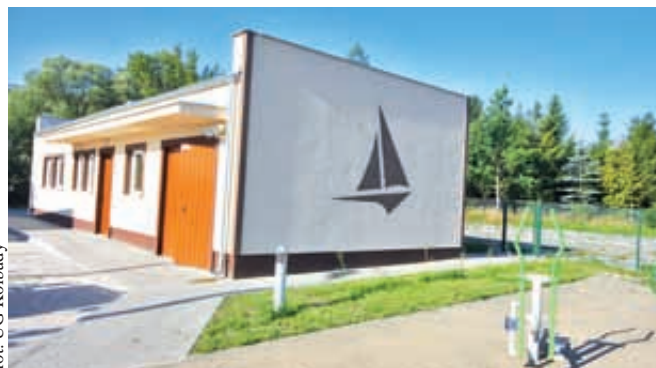
Zakończony został remont Przystani Żeglarskiej w Kolbudach

- Do połączenia Kolbud z Gdańskiem pozostaną nam do