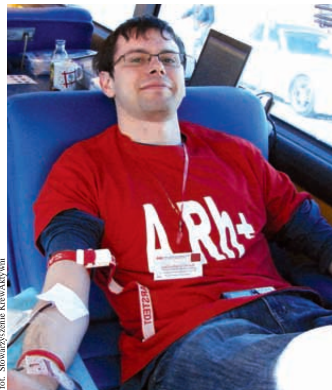
Oddanie krwi może uratować czyjeś życie