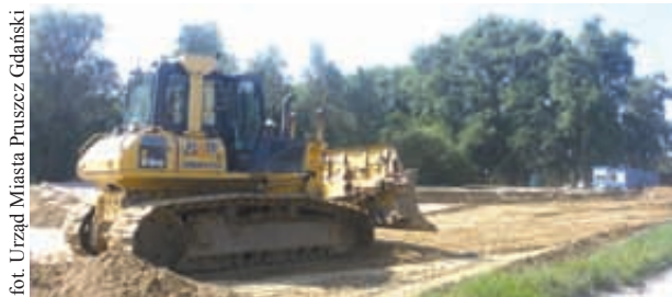
Remont ul. Grota Roweckiego