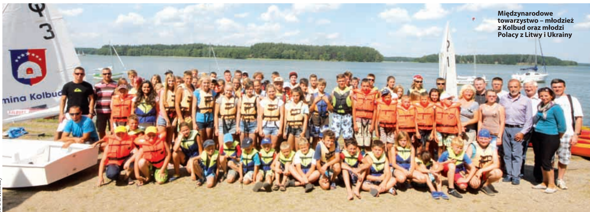
Międzynarodowe towarzystwo – młodzież z Kolbud oraz młodzi Polacy z Litwy i Ukrainy

Dobiega końca wizyta młodzieży z Litwy i Ukrainy w Kolbudach. Wcześniej z kolei nasza młodzież odwiedziła Bawarię.