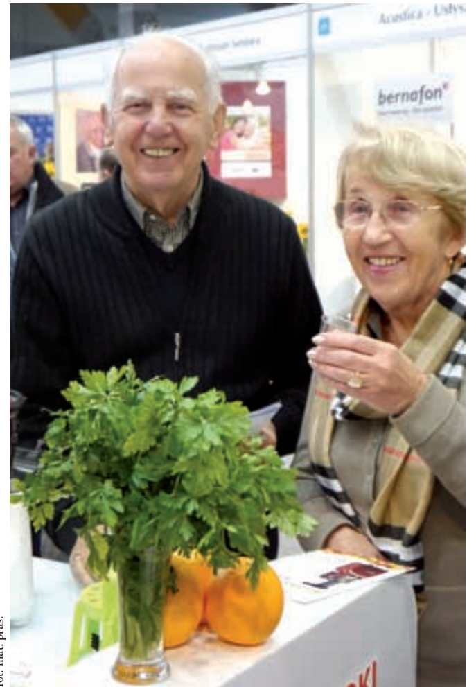
Nigdy nie jest za późno na piękny uśmiech w każdym wieku

Firmy, instytucje oraz organizacje zainteresowane udziałem mogą zgłaszać się do Biura Organizacyjnego Targów. Szczegółowe informacje: tel./fax 58 341-93-33, e-mail: biuro@targi-seniora.pl, www.targiseniora.pl. Oprac. DK