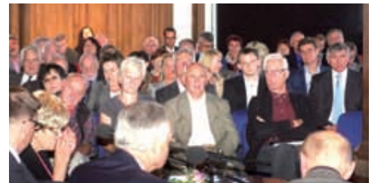
Publiczność licznie przybyła na promocję książki