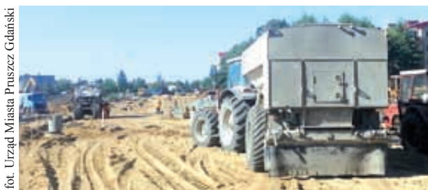
Prace na osiedlu Komarowo

Przełom lipca i sierpnia to pełnia sezonu remontowego. Obok przygotowań do startu największych letnich remontów - ulic Powstańców Warszawy, Obrońców Wybrzeża oraz Grota Roweckiego, trwają także mniejsze, niezwykle pożyteczne inwestycje.