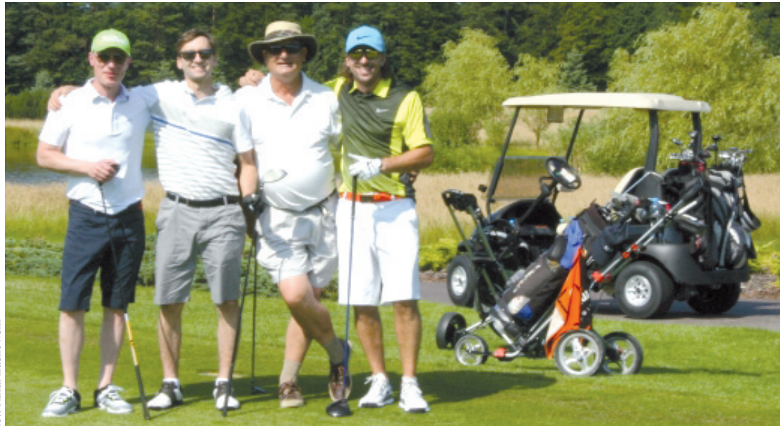
Wspólne chwile na polu golfowym

Rozgrywki odbyły się na terenie Sierra Golf Club, pod patronatem Expressu Biznesu. Gracze grali według definicji zawartych w Regulach Golfa R&A Rules Limited, w formacie Strokeplay Brutto, STB Netto. Rywalizowali zarówno panowie, jak i panie. To już kolejna odsłona takiego wydarzenia sportowego pod znakiem Porsche. Turniej obfitował w emocje oraz liczne atrakcje. Goście zostali powitani w Sierra GC lampką szampana. Potem zaczął się Turniej Tee times ora Akademii golfa. Po lunchu, wieczorem do dyspozycji gości był DJ, który zapewnił oprawę muzyczną, na chętnych czekało kasyno i open bar. Drugi dzień upłynął pod znakiem Turnieju Shotgun. Jednocześnie startowała Akademia Golfa dla początkujących. Po południu imprezę zakończyła uroczysta ceremonia rozdania nagród Turnieju oraz Akademii. Dorota Korbut