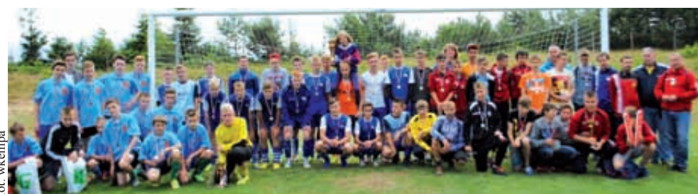
Drużyna ma powody do dumy

Z brązowym medalem z Finału Wojewódzkiego Turnieju Chłopców „Piłkarska Kadra CzeKa 2014” wróciła drużyna Gimnazjum im. Kazimierza Jagiellończyka z Trąbek Wielkich.