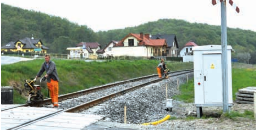
Prace remontowe miały szeroki zakres

obsługiwana przez nowoczesny tabor - 6 zespołów spalinowych wyprodukowanych przez NE-WAG z Nowego Sącza. Zostały one zakupione za ponad 50 milionów złotych przez województwo pomorskie w 2010 i 2011