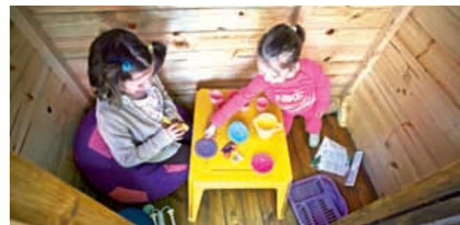
Drewniane chatki dla podopiecznych domów dziecka