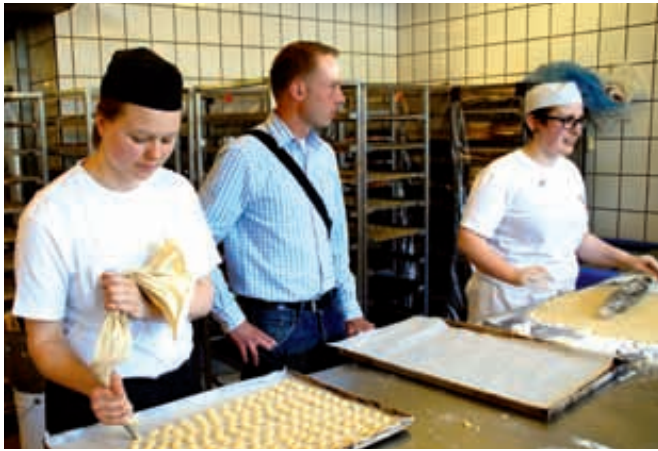
Młodzież przyglądała się pracy w polskich firmach

Gdańsk i okolice oraz uczyli się podstaw języka polskiego. Podczas wizyty w Pomorskich Szkołach Rzemiosł w Gdańsku mieli okazję zwiedzić pracownie dydaktyczne i zapoznać się z systemem szkolnictwa zawodowego w Polsce.