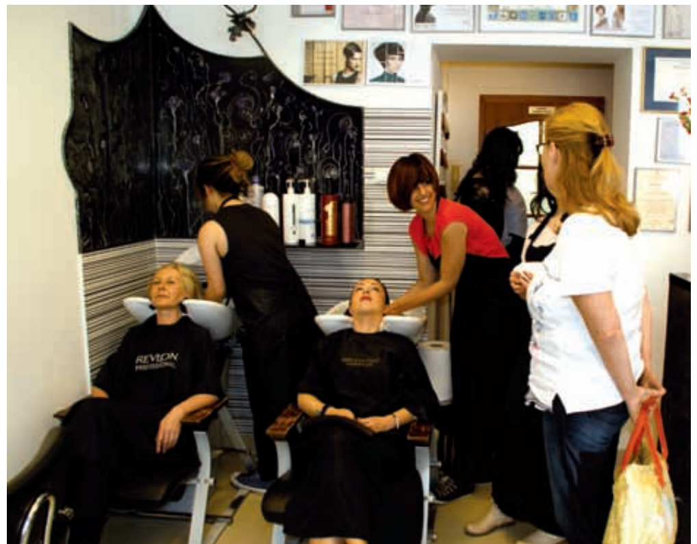
Praktykanci zdobywali doświadczenie