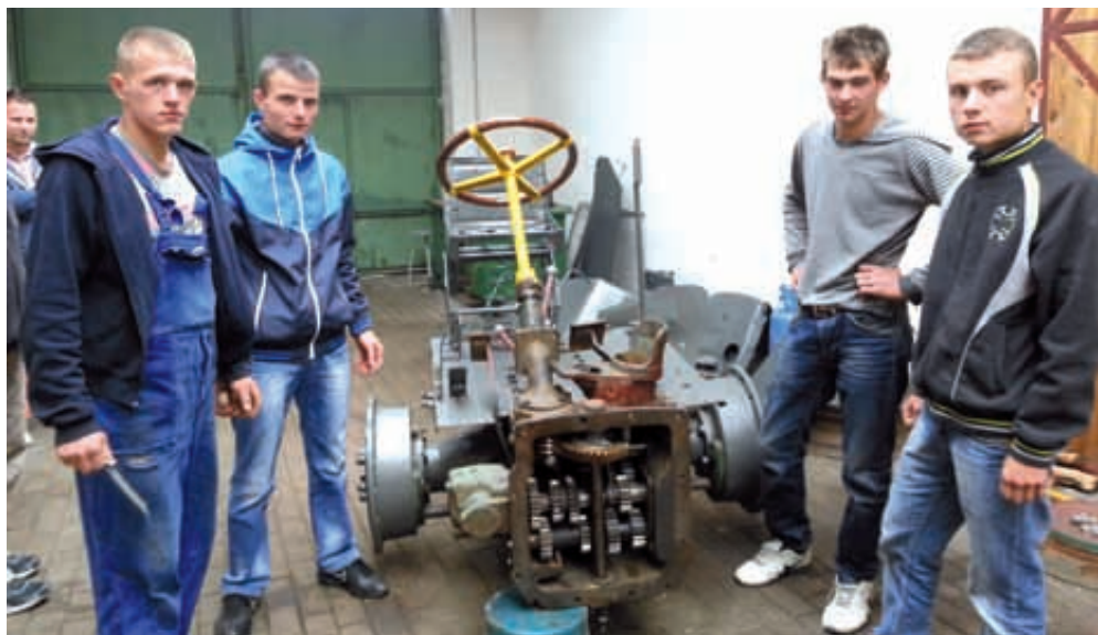
Uczniowie odbudowują ciągnik