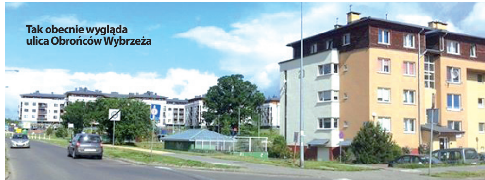
Tak obecnie wygląda ulica Obrońców Wybrzeża

Prace te będą realizowane w 2014 roku w ramach programu zwanego „Schetynówki”, czyli będą dofinansowane z Narodowego Programu Przebudowy Dróg Lokalnych. Umowę podpisano z konsorcjum firm: KRUSZYWO Sp. z o.o z siedzibą w Linii i FIRMĄ BUDOWLANO-USEUGOWĄ EWA WICKA z siedzibą w Luzinie. W uroczystości podpisaniu umowy wzięli również udział wójtowie gmin z terenu powiatu, które będą beneficjentami ww. programu. W tym roku do realizacji zadania przystąpiły wszystkie gminy. Całościowy koszt prac wynosi 12.150.000 zł. Pierwsze prace rozpoczną się już na początku przyszłego tygodnia od budowy chodnika w ciągu drogi powiatowej w miejscowości Błotnik oraz od remontu drogi Egiertowo-Przywizd w miejscowości Klonowo Dolne. Zakończenie prac przy budowie 30 km dróg i 3