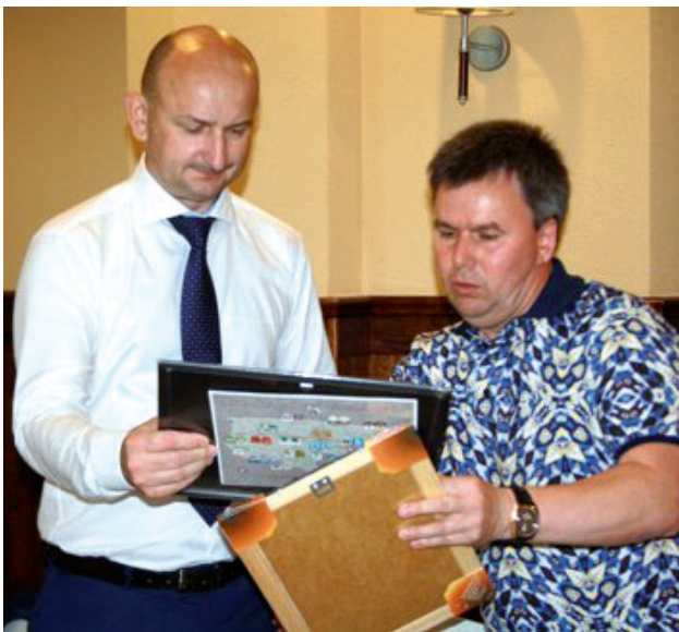
U.G. Pruszcz Gdański