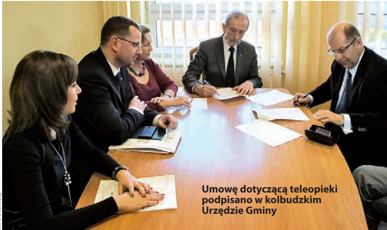
Umowę dotyczącą teleopieki podpisano w kolbudzkim Urzędzie Gminy

Teleopieka jest bowiem usługą dającą możliwość całodobowego wezwania pomocy w przypadku zagrożenia życia, zdrowia lub bezpieczeństwa. Wykorzystuje nowoczesne technologie, oparte na współdziałaniu trzech elementów: osobistego nadajnika noszonego przez podopiecznego na przegubie ręki lub w formie wisiora na szyi, terminala umożliwiającego kontakt z operatorem i Centrum Operacyjno-Alarmowym. Dorota Korbut