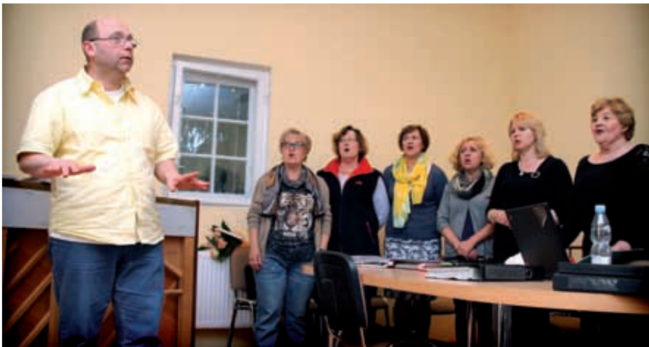
U.G. Pruszcz Gdański

- Nie trzeba umieć śpiewać. Nasz „profesor” odkryje talent w każdym. Trzeba być jednak wytrwałym, żeby ten proces przetrwać – żartują jedni.