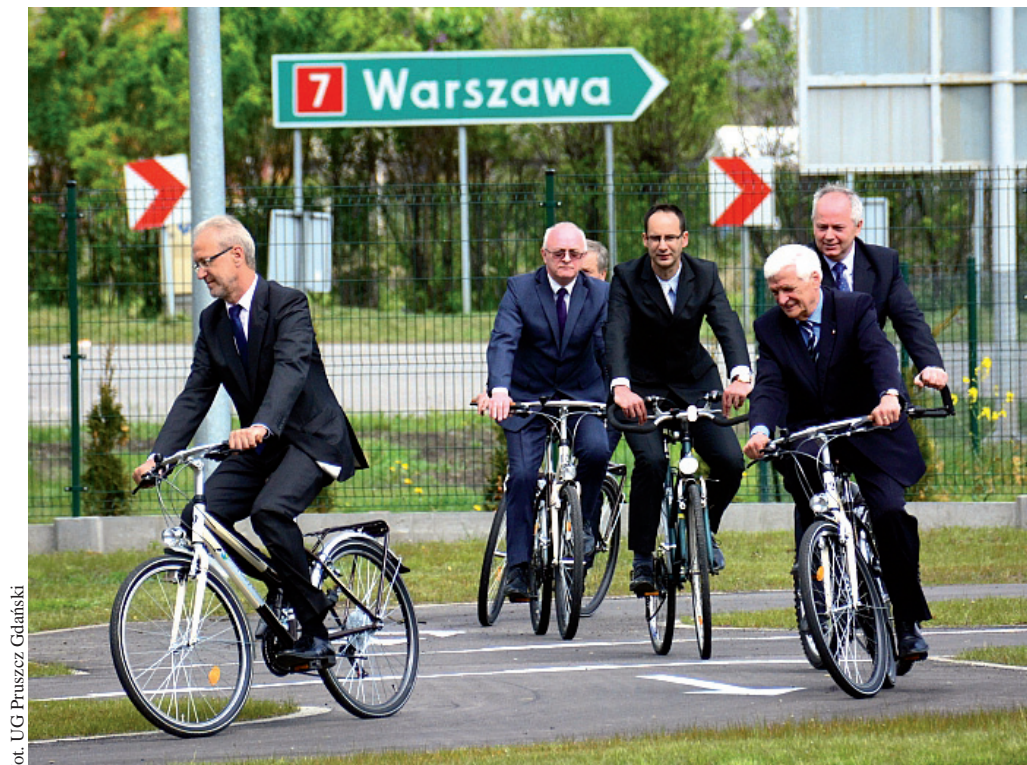
U.G Pruszczyk Gdański

Na scenie odbywały się liczne konkursy wiedzy o Unii Europejskiej i inne, przeprowadzone przez wystawców - partnerów gminy Cedry Wielkie. Podczas pikniku nie zapomniano również o najmłodszych mieszkańcach gminy i specjalnie dla nich zorganizowano blok animacyjny z konkursami, piosenkami, tańcami i zabawami ruchowymi.