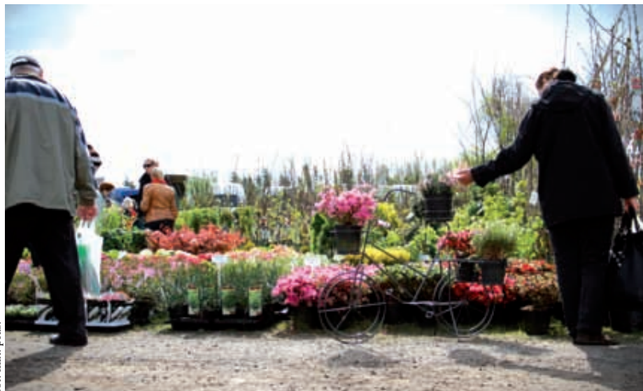
fol. mat. pras.

XXIII Targi Rolno-Przemysłowe i Pomorska Wojewódzka Wystawa Zwierząt Hodowlanych odbędą się 7 i 8 czerwca 2014 roku pod honorowym patronatem marszałka województwa pomorskiego Mieczysława Struka, w Lubaniu k/ Kościerzyny.