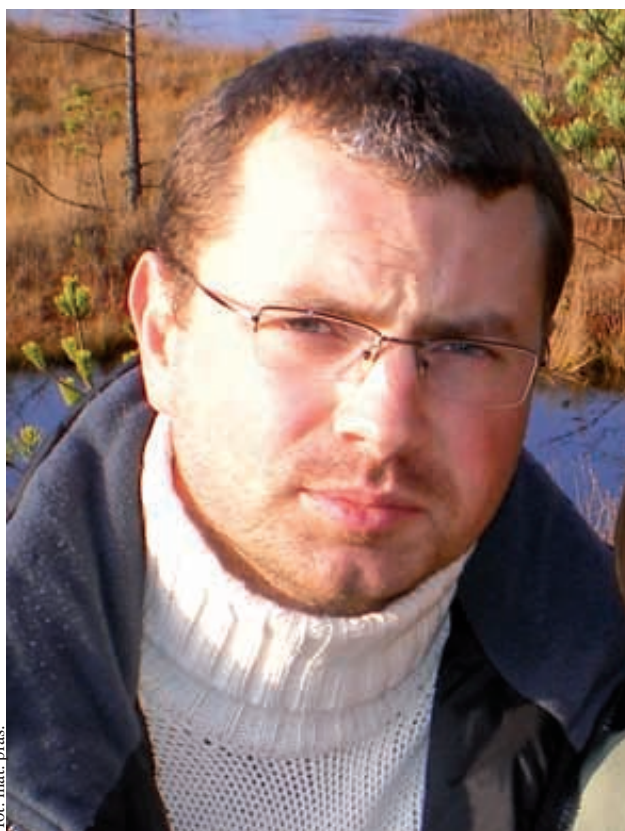
fol. mat. pras.

sprowadza się jedynie do naciśnięcia czerwonego przycisku. Całą resztą zajmie się Centrum Operacyjno-Alarmowe. Zatem pomoc zostanie udzielona nawet w przypadku, gdy poszkodowany po naciśnięciu przycisku straci przytomność.