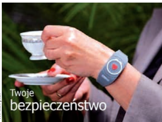
fol. mat. pras.

Urządzenie uruchamia się w razie interwencji przez nadajnik z dowolnego miejsca mieszkania i umożliwia rozmowę z operatorem, znajdującym się w Centrum Operacyjno-Alarmowym.