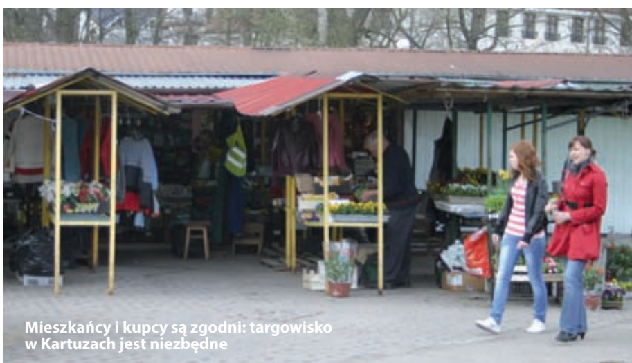
Mieszkańcy i kupcy są zgodni: targowisko w Kartuzach jest niezbędne