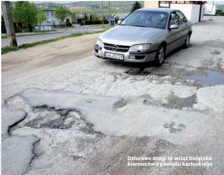
Dziurawe drogi to wciąż bolączka kierowców z powiatu kartuskiego

Dlatego na łamach naszej gazety rozpoczynamy dziś akcję: pokażmy, na co wspólne pieniądze powinny być wydane w 2013 roku! Czy wyremontowana powinna być np. jakaś konkretna ulica w Kartuzach? A może więcej funduszy z gminnego budżetu