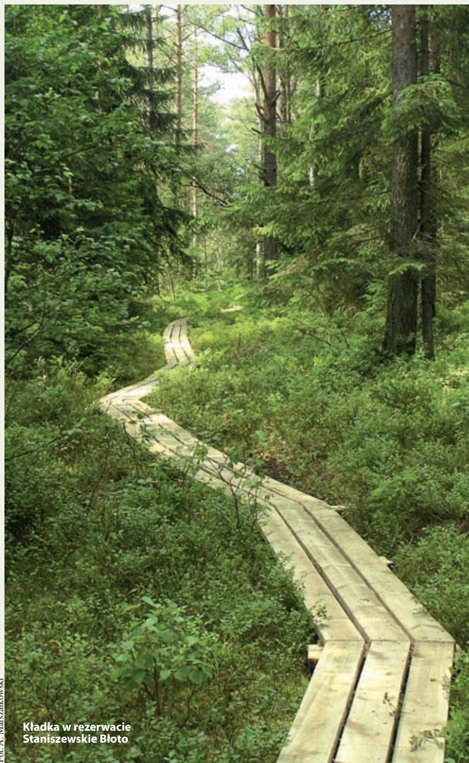
Kładka w rezerwacie Staniszewskie Błoto

Mamy ich już ponad 20%, ale chcemy aby w ciągu kilkudziesięciu lat było ich po-