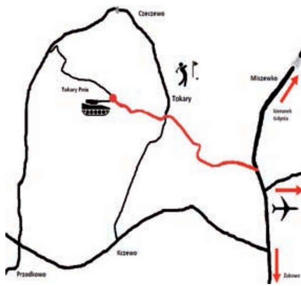
Trasa przemarszu zbrojnej kolumny

Widowisko poprzedzone będzie rajdem pojazdów biorących udział w inscenizacji. Rekonstruktorzy w autentycznym umundurowaniu, w piątek 17 sierpnia o godz. 16:00, zawitają na Rynku w Kartuzach, gdzie zapraszają do udziału w inscenizacji. Później ruszą do Gdańska, gdzie odwiedzą Stare Miasto. Rajd zakończy się na dworcu PKS w Gdańsku. W widowisku udział wezmą znane w Polsce grupy rekonstrukcyjne: Grupa Inscenizacji Historycznych „Pomerania 1945”, Samodzielna Grupa Odtworzeniowa „Pomorze”, Stowarzyszenie Miłośników Broni Pancerniej i Historii „Pancerny Niedźwiedź”, GRH Reichshof, GRH „Zwiewda”, Kaliningradzkie Stowarzyszenie Historyczne „Soldaty” i Stowarzyszenie Miłośników Broni Pancerniej „Pantera”. Podczas inscenizacji wolon-