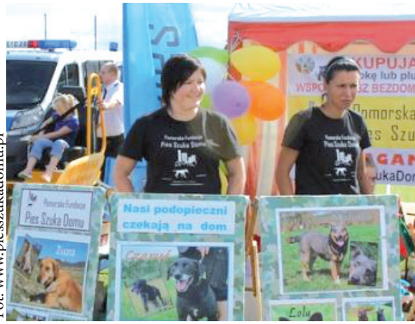
Stoisko fundacji na festynie w Chmielnie