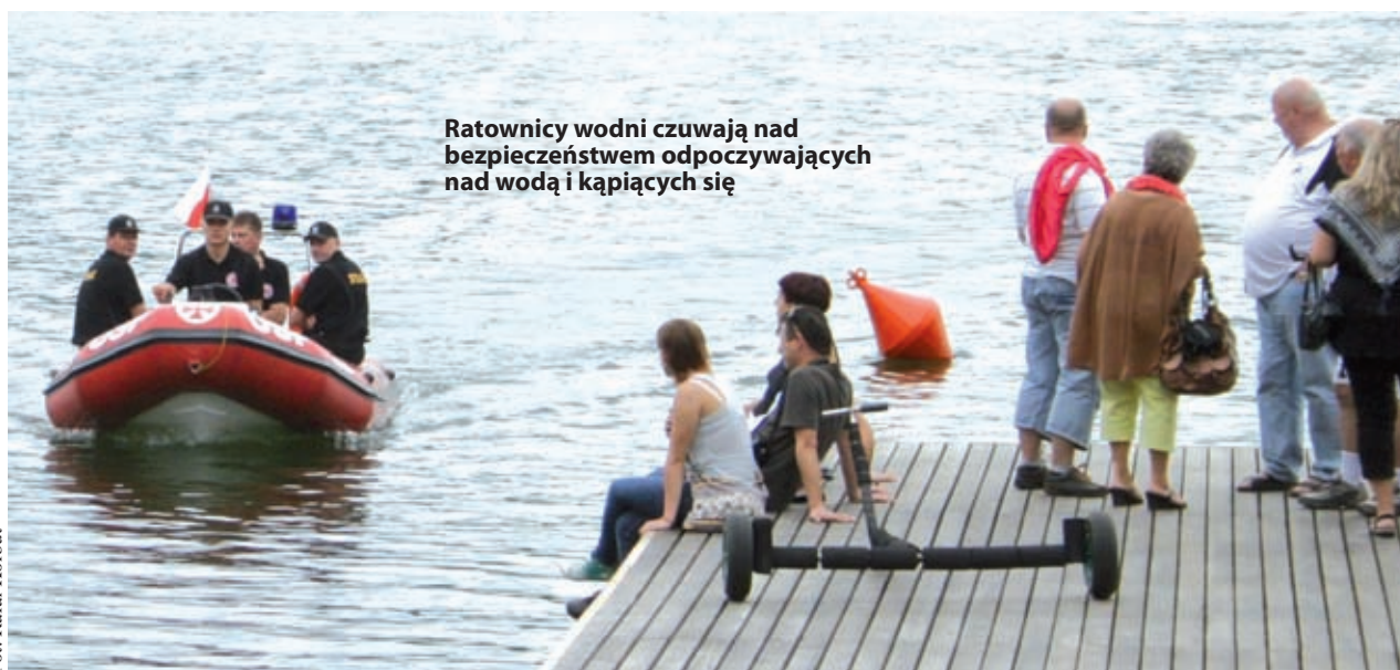
Ratownicy wodni czuwają nad bezpieczeństwem odpoczywających nad wodą i kąpiących się

Co roku w powiecie kartuskim w okresie letnim nad jeziorami dochodzi do tragicznych zdarzeń, w których ludzie tracą życie. W tym roku niespełna miesiąc temu w Kosowie (gm. Przdokowo) utonął mężczyzna, który kąpał się w stawie. W pewnym momencie zanurkował i już nie wypłynął na powierzchnię. Na początku tego miesiąca doszło do kolejnej tragedii – w Jeziorze Gowidlińskim utonął 57-letni mieszkaniec Gdańska. Z ustaleń policji wynika, że mężczyzna zanim wszedł do wody spożywał alkohol. Aby odnaleźć ciało strażacy musieli użyć specjalnej kamery, a do jego wydobycia z wody konieczne było wezwanie nurków. Natomiast kilka dni temu w Mściszewicach (gm. Sulęcyno) z nieustalonych jeszcze przyczyn do jeziora wjechał samochód, którym podróżowały 4 osoby (w tym trójka dzieci). Auto zaczęło tonąć, na pomoc zostali wezwani ratownicy. Gdy