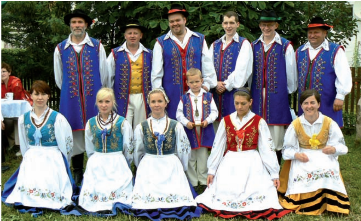
Fot. Daria Dunajska

- Impreza propaguje i kształtuje dumę bogactwa