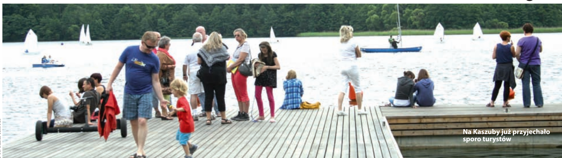
Na Kaszuby już przyjechało sporo turystów

LATO | Kilka dni temu rozpoczęły się długo wyczekiwane wakacje. I chociaż ostatnio pogoda płata figle przez najbliższe tygodnie dobrej zabawy, rozrywki i wypoczynku z pewnością nie zabraknie. A jakie atrakcje zaplanowano na najbliższe kilka dni? Więcej na str. 3