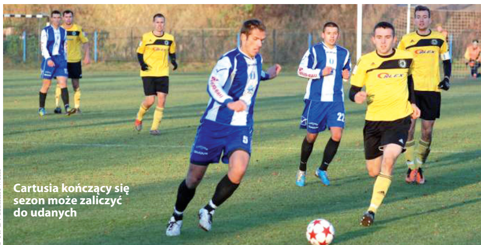
Cartusia kończący się sezon może zaliczyć do udanych

Trzy kolejki natomiast mają do rozegrania jeszcze zespo-