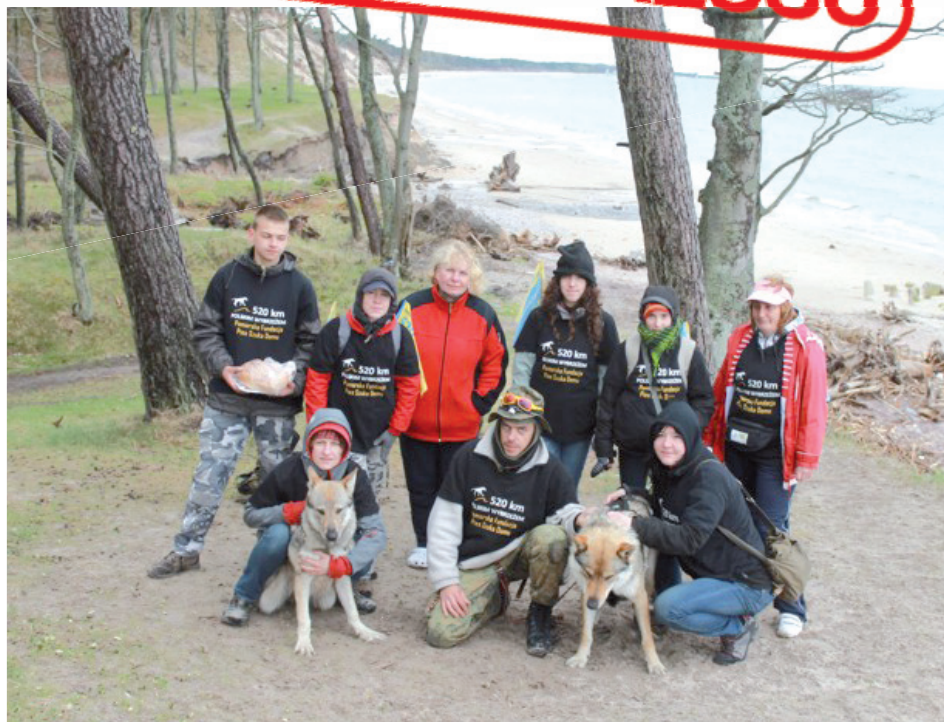
Fot. Artur Lewandowski (4)

- To niesamowite przeżycie, nie da się porównać do niczego innego – relacjonuje z trasy Artur Lewandowski. - Mijam przepiękne miejsca, przyrodę, spotykam interesujących ludzi