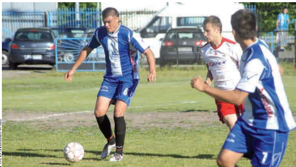
Do rozegrania pozostały jeszcze cztery kolejki