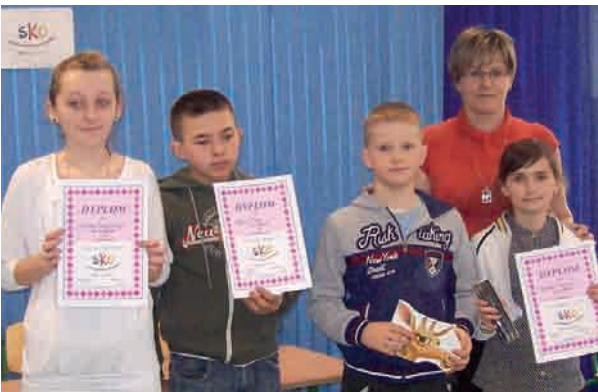
Młodzi mistrzowie ekonomii