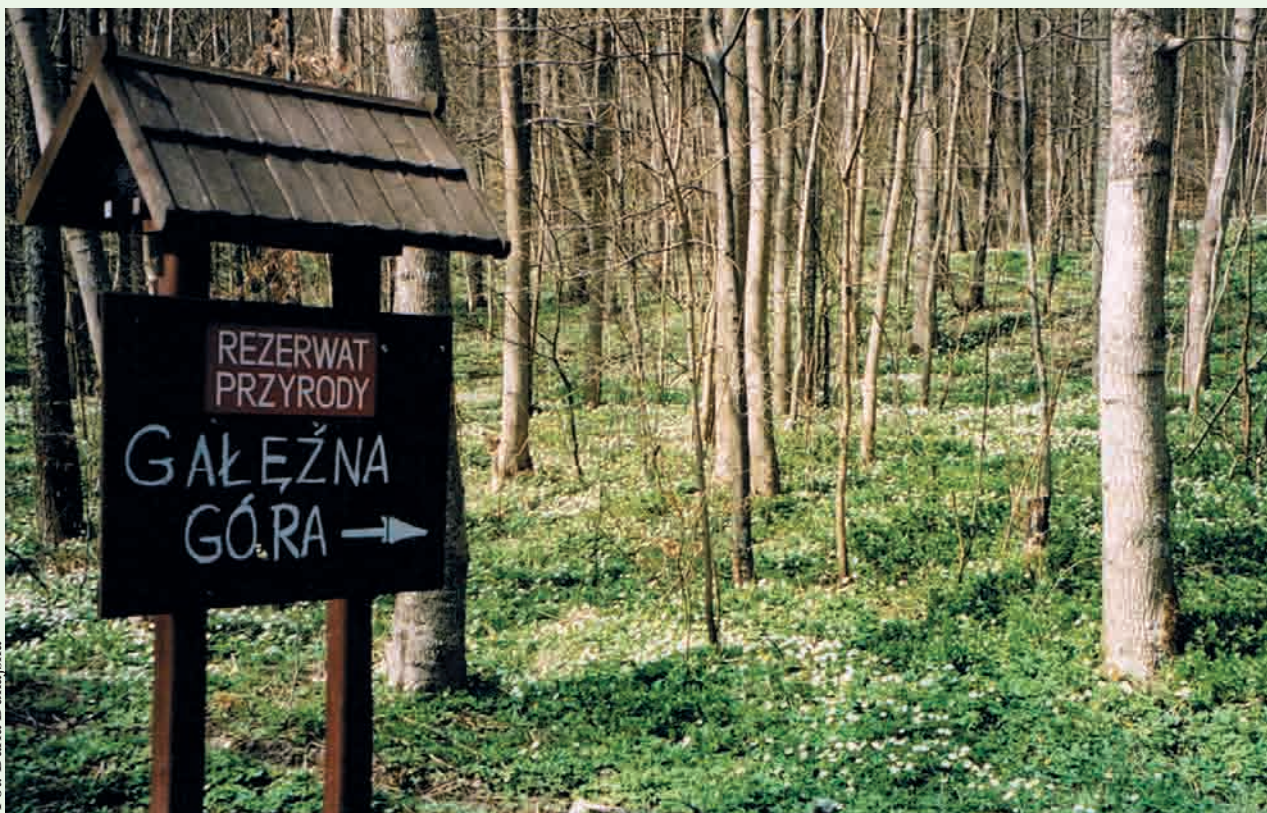
Rezerwat Gałęzna Góra z chronionymi gatunkami roślin, zwierząt i grzybów oraz wczesnośredniowiecznym grodziskiem i cmentarzyskiem kurhanowym

PRZYRODA | Na wniosek Lasów Państwowych powstały dwa nowe użytki ekologiczne w Leśnictwie Orle, Kamień i Stara Piła. Regionalna Dyrekcja Ochrony Środowiska w Gdańsku zleciła projekt planu ochrony rezerwatu przyrody Gałęzna Góra.