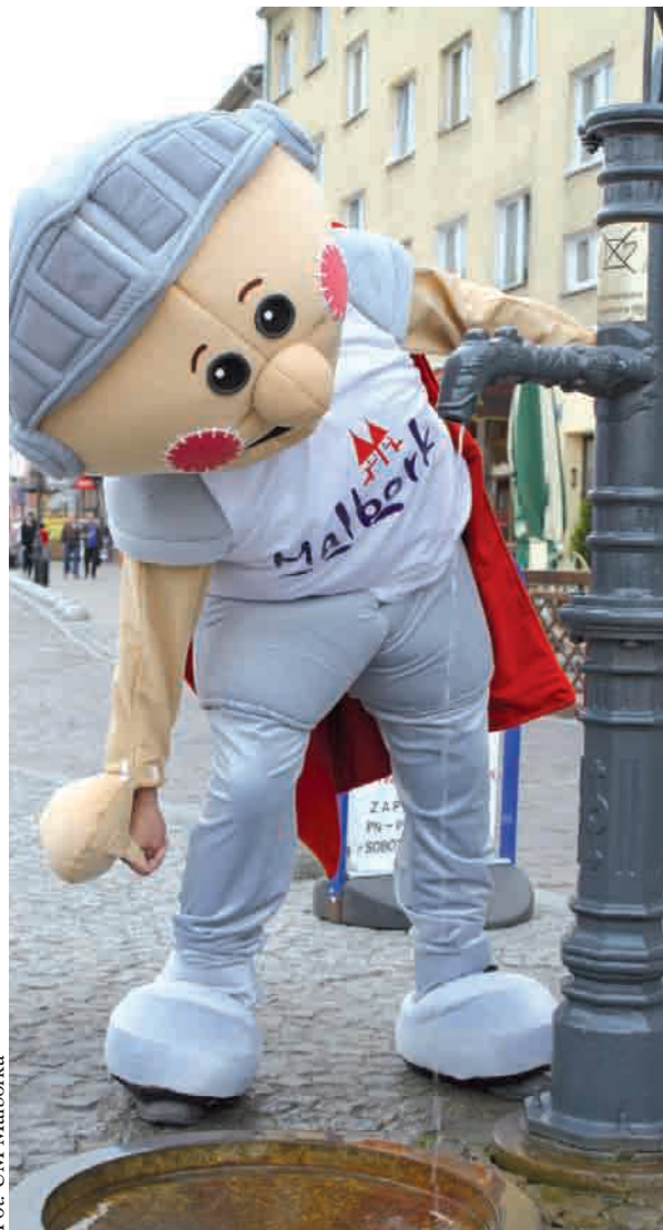
Malbork od dawna ma swoją maskotkę - Marianka