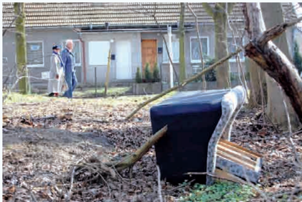
Na terenie Sierakowic odpady będą odbierane bezpośrednio z poszczególnych posesji

Akcja dotyczy niepotrzebnych i zniszczonych rzeczy wielkogabarytowych. Do takich zaliczają się: opony, telewizory, komputery, mo-