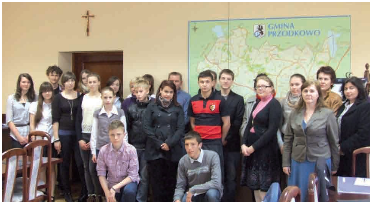
Wśród wyróżnionych znalazło się 14 gimnazjalistów