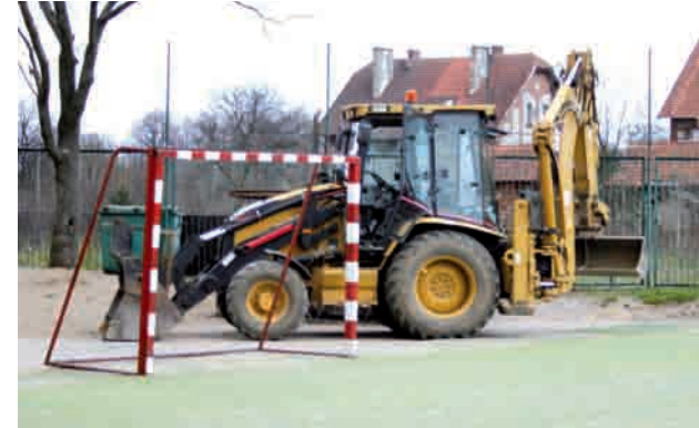
Prace ziemne zostały wykonane w tym tygodniu, urządzenia mają być zamontowane w maju

są wykonywane prace ziemne, a przede wszystkim wywóz prawie 300 m sześciennych ziemi oraz nawiezenie warstwy piasku. Następnie w ciągu 2-3 tygodni zostaną zamontowane urządzenia na placu zabaw. Wśród wybranych sprzętów na placu przy szkole znajdują się zestawy „Kuba”, „Monika”, „Małpi Gaj”, karuzela „Daniel”, huśtawki, sprężynowce, piaskownica oraz 3