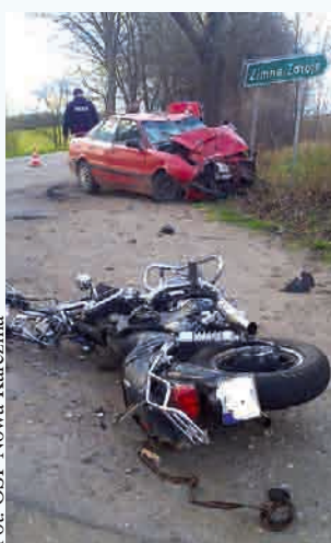
W wypadku zginęły trzy osoby, zaś trzy zostały lekko ranne

Drugim z poszkodowanych był 60-letni mężczyzna (mąż 57-latki). Natychmiast rozpoczęto udzielanie pierwszej pomocy, później prowadzona była bardzo długa akcja reanimacyjna. Mężczyznę przewieziono do szpitala w Kościerzynie, ale krótko po