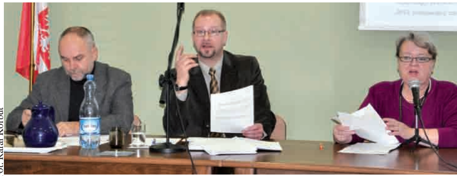
Radni gminy Sierakowice przegłosowali budżet na ten rok

Kolejne punkty spośród inwestycji to poprawa bezpieczeństwa w obrębie dróg wojewódzkich nr 211 i 214 poprzez usprawnienie układu komunikacyjnego w miejscowości Sierakowice (za 730 tys. zł), wykup gruntów (100 tys. zł), rozbudowa budynku mieszkalnego i stworzenie w części budynku świetlicy wiejskiej w Paczewie (300 tys. zł) oraz tzw. „zakupy inwestycyjne”