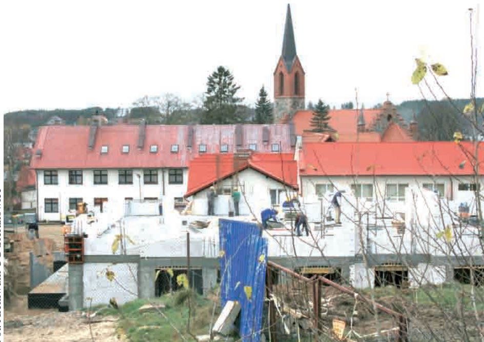
PNą się mury nowego skrzydła szkoły w Gowidlinie

śla 8 mln 290 tys. złotych. W Zespole Szkół w Kamienicy Królewskiej natomiast prace już się zakończyły. Placówka została nie tylko rozbudowana, ale również wyposażona w nowy sprzęt. Budynek przeszedł gruntowny remont, ponieważ poprzednie warunki były zdecydowanie niedostosowane do stale rosnącej liczby uczniów. Wybudowano nowy łącznik, w którym znajdują się szatnie oraz sale lekcyjne. Połączył on starą część szkoły z nową salą gimnastyczną, którą oddano do użytku jeszcze w tym roku. Cała inwestycja nie należała do najtańszych, bo pochłonęła przeszło cztery miliony złotych, ale gminie udało się uzyskać spore dofinansowanie. Ponad 80t tys. zł dołożył bowiem Europejski Fundusz Rozwoju Regionalnego, a 100tys. zł Ministerstwo Sportu i Turystyki.