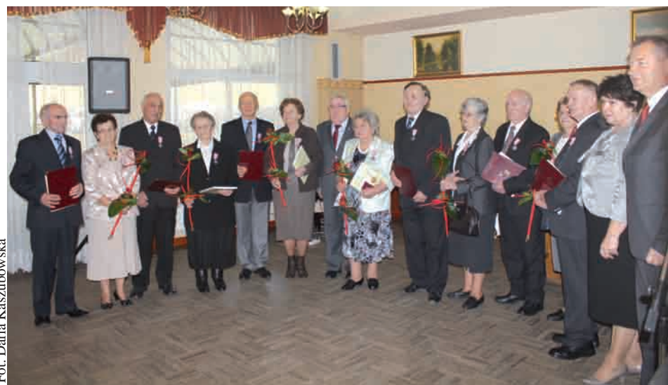
Jubilaci otrzymali odznaczenia od prezydenta RP oraz upominki