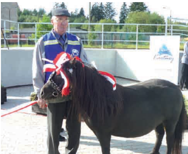
Czy teraz targowisko zapełni się handlującymi?

Na ostatniej sesji Rady Miejskiej w Kartuzach rajcy „wzięli w obroty” otwarte we wrześniu targowisko zwierzęce przy ulicy Sędzickiego. Od lat mówiło się o potrzebie takiego targowiska w mieście, zwłaszcza po likwidacji miejsca targu na ulicy Sambora. Tymczasem okazuje się, że brakuje chętnych rolników do sprzedawania tam swoich zwierząt i płodów rolnych. W dni targowe świeci pustkami, bywa, że pojawiają się tam zaledwie kilku mieszkańców. Jaka