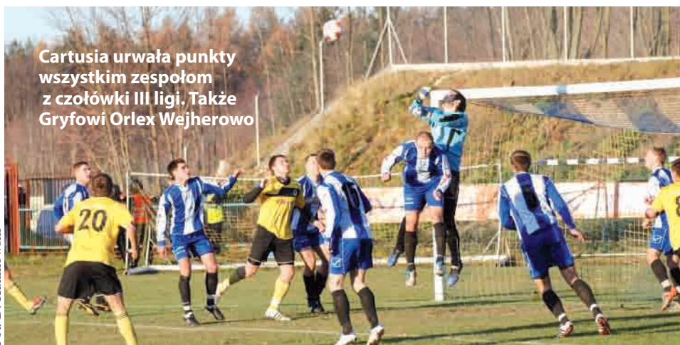
Cartusia urwała punkty wszystkim zespołom z czołówki III ligi. Także Gryfowi Orlex Wejherowo