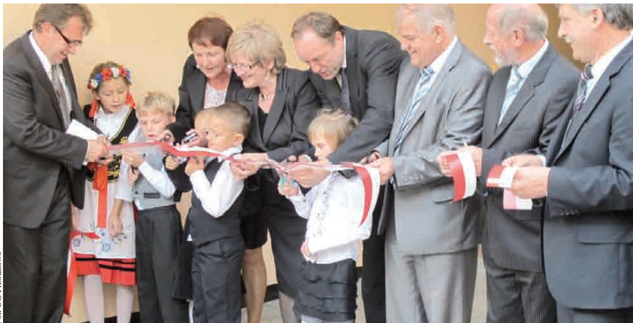
Szkoła Podstawowa w Przdokowie została rozbudowana o ponad 1 tys. m kw.