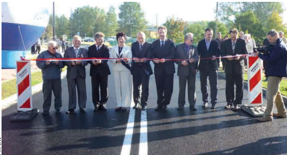
Przecięcie wstęgi na nowym odcinku ulicy Kolejowej

INWESTYCJE | Kartuska schetynówka, łącząca ulicę Kościuszki z ulicą Dworcową, od dwóch tygodni jest już dostępna dla kierowców. Inwestycja pochłonęła blisko 4,5 miliona złotych.