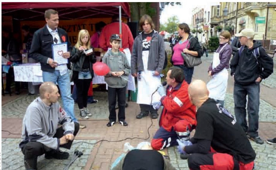
Kurs pierwszej pomocy wykonany przez pracowników szpitala

ZDROWIE | Powiatowe Centrum Pomocy Rodzinie w Kartuzach zorganizowało dla mieszkańców festyn pod nazwą „Serce Twoim Przyjacielem”. Chętni mogli wziąć udział w kursie pierwszej pomocy, posmakować zdrowych potraw, a także skorzystać z bezpłatnych badań.