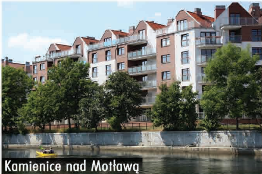
Kamienice nad Motławą