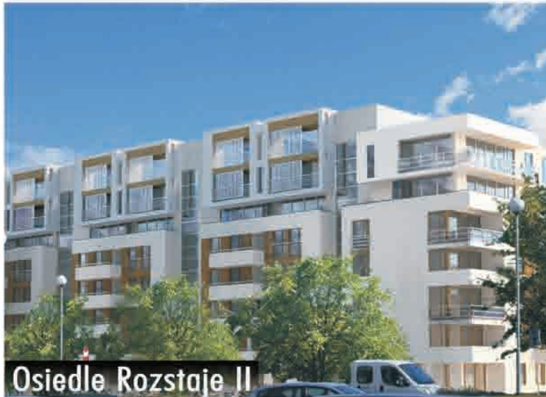
Osiedle Rozstaje II