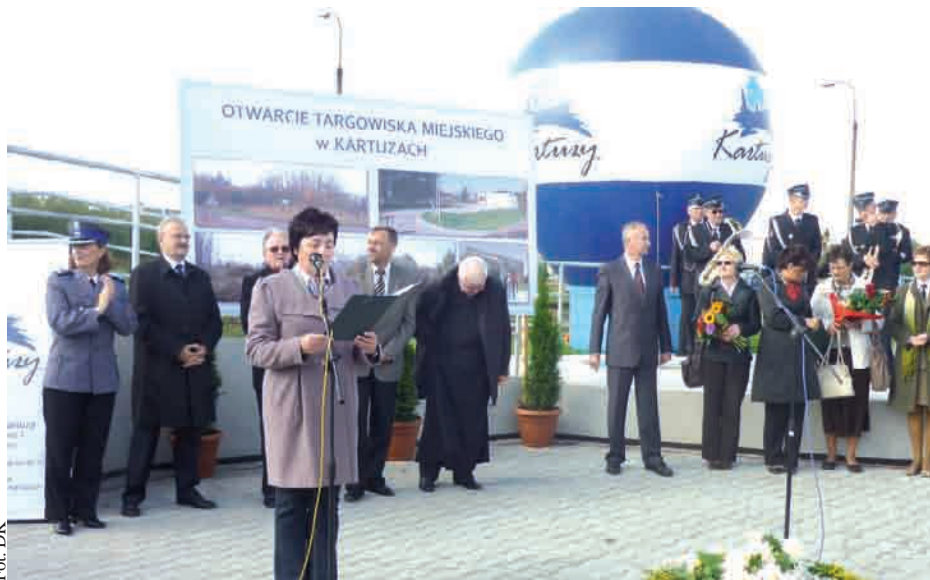
Targowisko rozpocznie działalność na początku października

Na otwarciu nie zabrakło władz samorządowych gminy, powiatu i województwa,