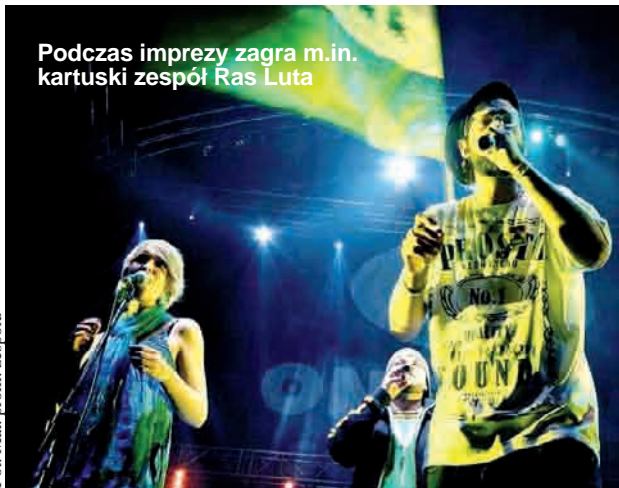
Podczas imprezy zagra m.in. kartuski zespół Ras Luta