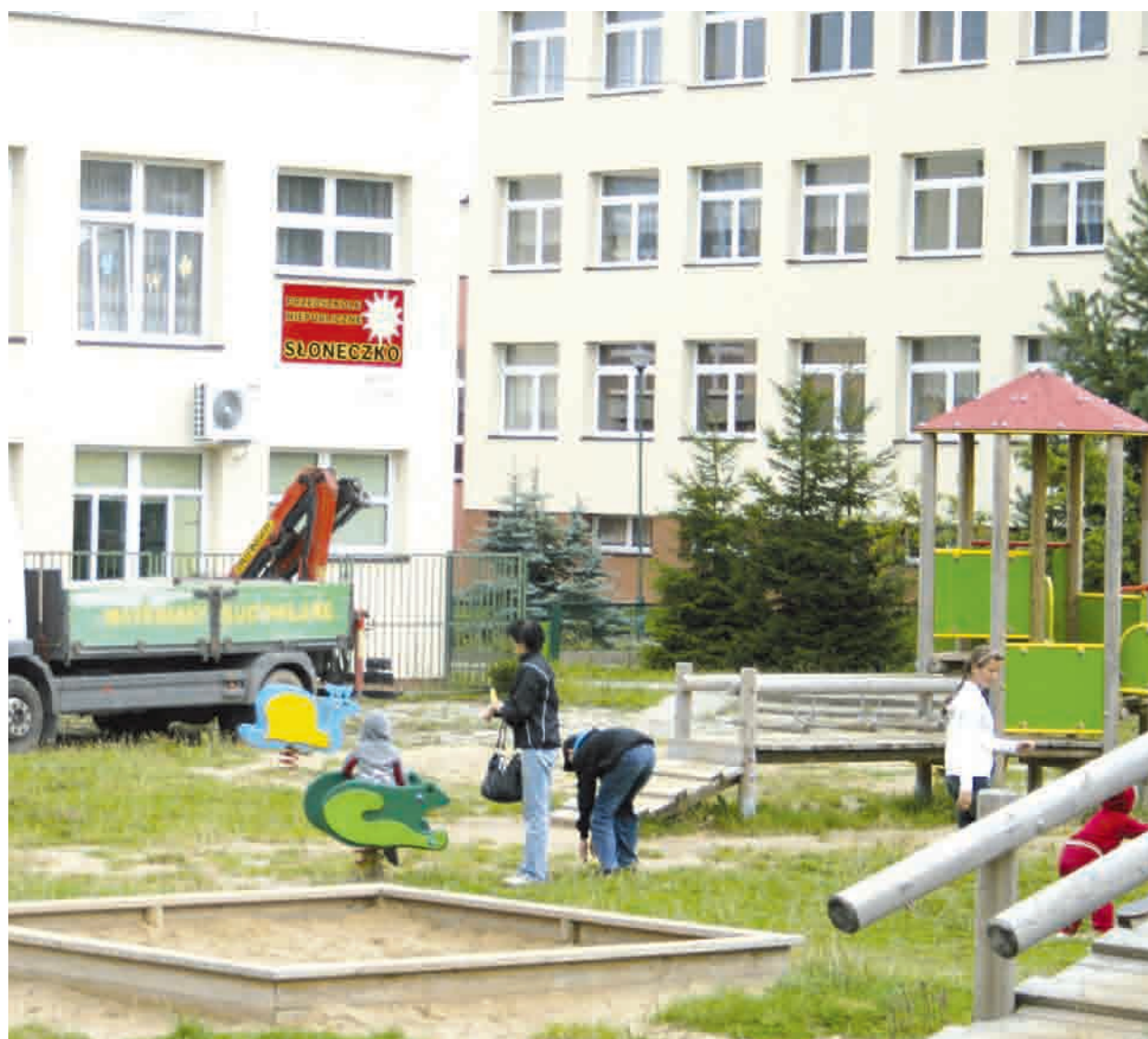
Przedszkole „Słoneczko” w Kartuzach przestaje istnieć