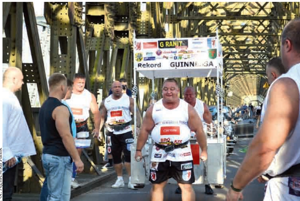
17 minut zajęło siłaczom przeniesienie lektyki

Zadaniem 10 osobowej grupy strong Man było przeniesienie 500 kg lektyki na dystansie 1000 metrów. Zawodnicy nieśli lektykę w parach, po dwie osoby. W czasie trwa-