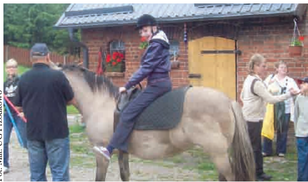
Hipoterapia od lat jest stosowana z powodzeniem w rehabilitacji niepełnosprawnych

skoncentrowane. Wyjazdy do ośrodka odbywały się w grupie, dlatego też był to znakomity sposób integracji dzieci oraz ich rodziców. Specjalistyczna pomoc w postaci zajęć rehabilitacyjnych, terapii na koniach sprawia, że dzieci niepełnosprawne oraz ich rodziny dają sobie coraz lepiej radę z problemem, którym jest niepełnosprawność.