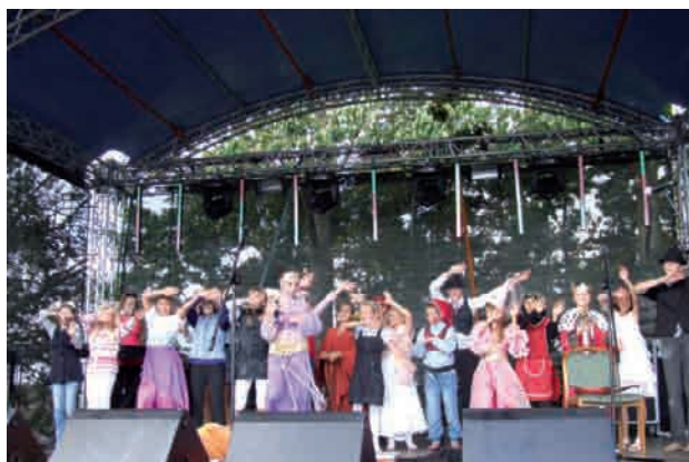
Dzieci z zespołu Pater Noster