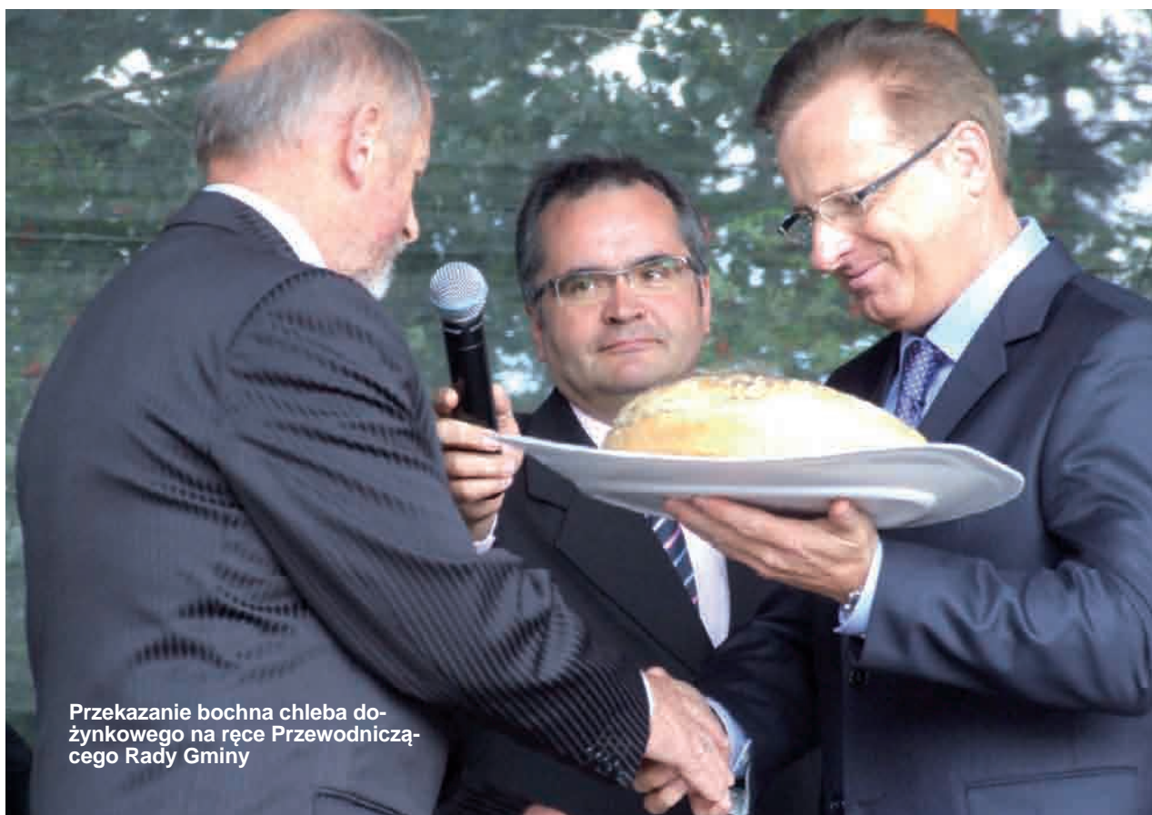
Przekazanie bochna chleba dożynkowego na ręce Przewodniczącego Rady Gminy

Decyzją sołtysów na dożynkach powiatowych w Sulęcynie gminę Przodkowo reprezentował będzie wieńiec sołectwa Rąb i kołaczki sołectw Załęże i Kobyszewo.