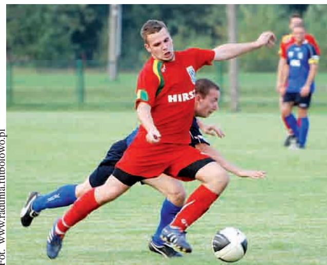
Piłkarze Raduni Stężyca są liderem V Ligi

Swoją wysoką formę piłkarze Raduni potwierdzili w zeszłą sobotę