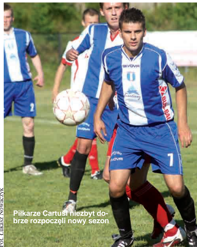
Piłkarze Cartusi niezbyt do- brze rozpoczęli nowy sezon