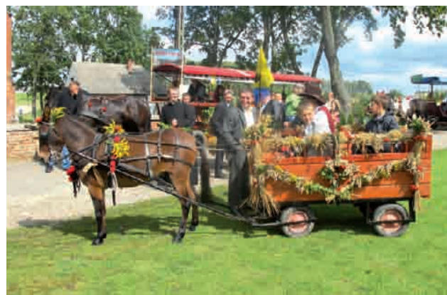
Jeden z zaprzęgów sołectwa Załęże