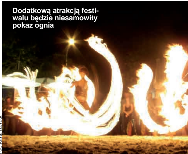
Dodatkową atrakcją festiwalu będzie niesamowity pokaz ognia