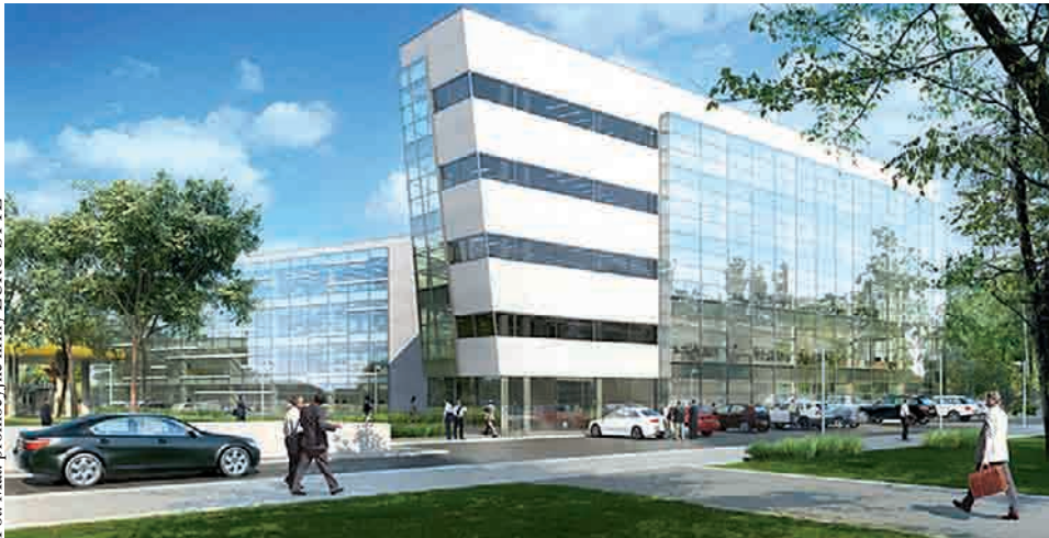
Coraz więcej firm deweloperskich decyduje się na realizację budynków komercyjnych. Na wizualizacji „OPERA Office”, inwestycja firmy EURO-STYL

skontrolować rynek w danym miejscu. Nie należy więc wybierać miejsc, w których konkurencja jest zbyt silna, ale warto pamiętać, że firma może dobrze