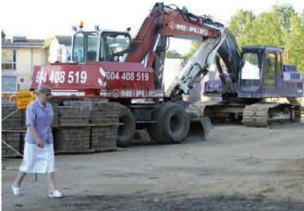
Przebudowa ulicy Kolejowej trwa, prace mają zakończyć się we wrześniu tego roku

Przypomnijmy, że o budowę ul. Kolejowej władze gminy starały się od daw-