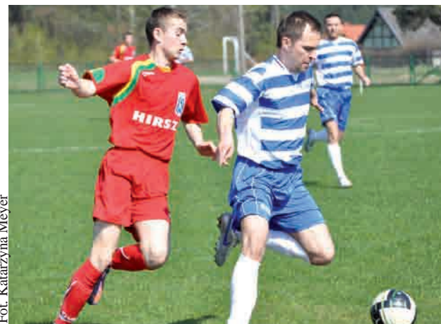
Fot. Katarzyna Meyer