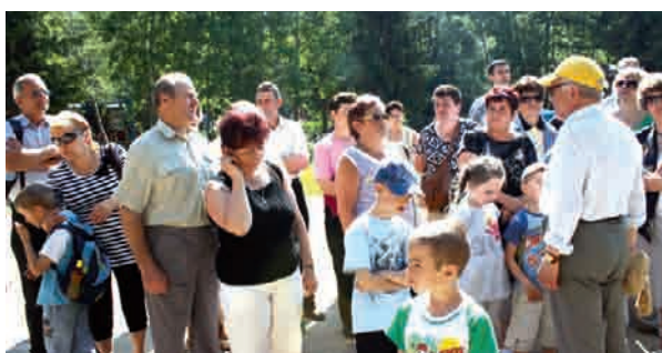
Wszyscy doskonale bawili się na wycieczce

INTEGRACJA | Już niemal tradycją stała się wspólna coroczna wycieczka uczniów ze szkoły podstawowej w Przdokowie i ich dziadków.