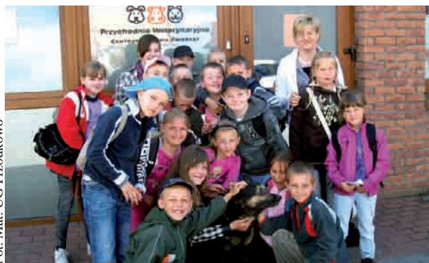
Pamiątkowe, wspólne zdjęcie