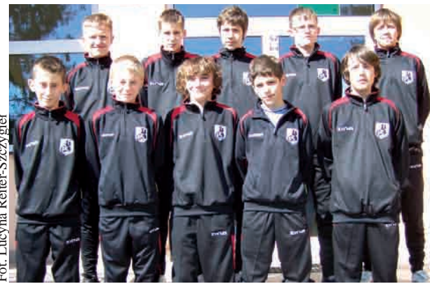
Młodzi rugbyści z Czeczewa

W meczu o III miejsce Czeczewo przegrało z Lechią 0:7. W finale Arka wygrała 7:0 z SP 10 Gdynia. Trenerem obu zespołów jest Paweł Bil.