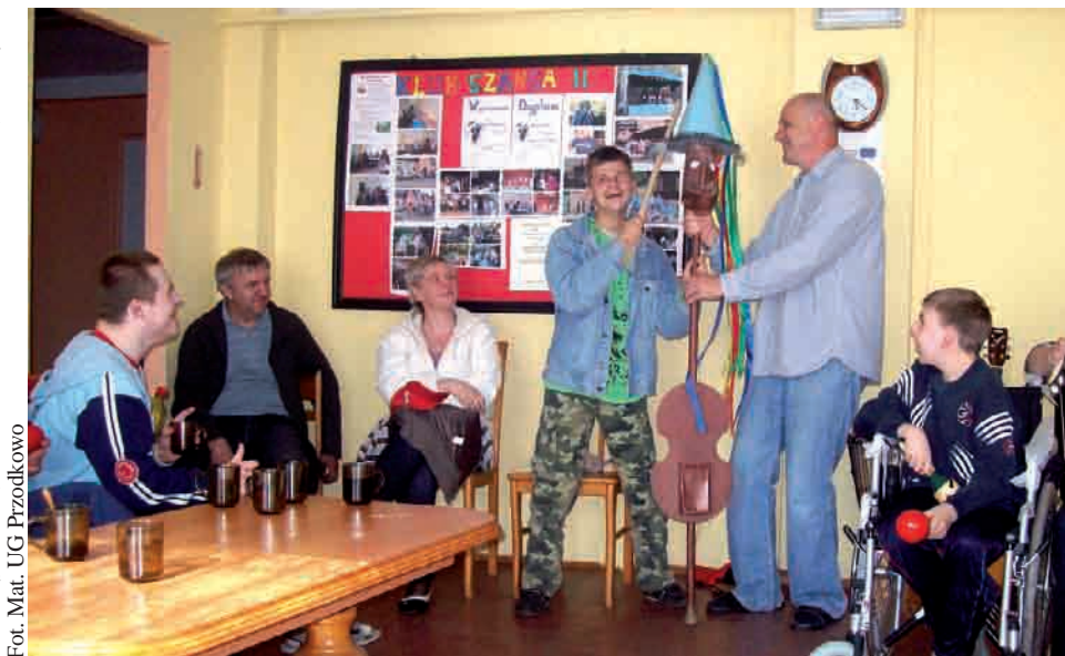
Podczas spotkań uczestnicy poznają ludowe instrumenty muzyczne, jak np. diabelskie skrzypce

Środki na spotkania muzyczne pochodzą z budżetu gminy Przdokowo. Program realizowany jest przez Stowarzyszenie „Tacy Sami”, które pragnie zagospodarować osobom niepełnosprawnym wolny czas, rozwijać ich umiejętności muzyczne oraz rehabilitować ich poprzez sztukę.