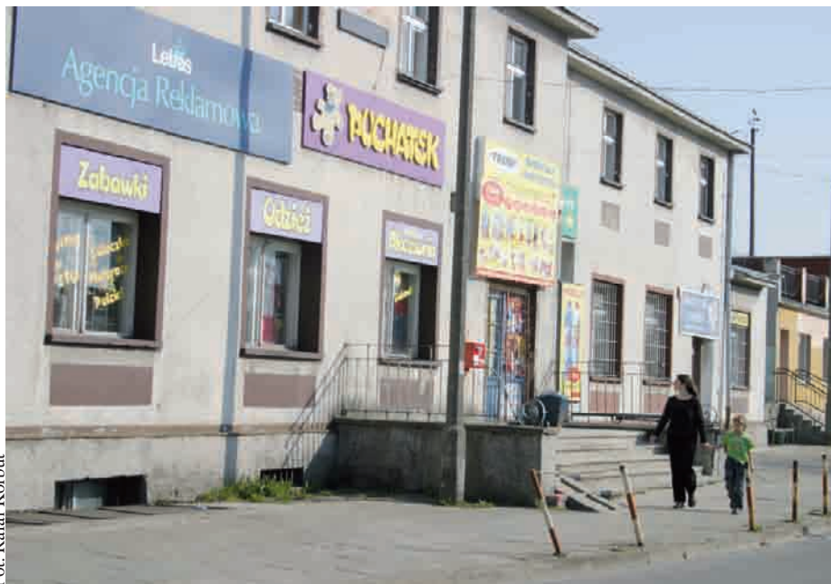
Dworzec w Kartuzach

KOLEJ | Dworce kolejowe w powiecie kartuskim niszczeją, a kolej na remont nie ma pieniędzy. Szansą na odnowienie budynków byłoby przejęcie ich przez gminy. Takim rozwiązaniem zainteresowane są Sierakowice i Żukowo, możliwości przejęcia dworca nie wykluczają też przedstawiciele władz gminy Kartuzy.