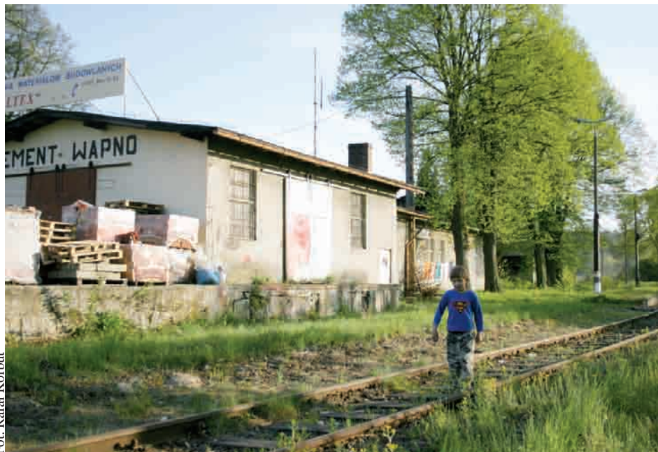
Dworzec w Żukowie