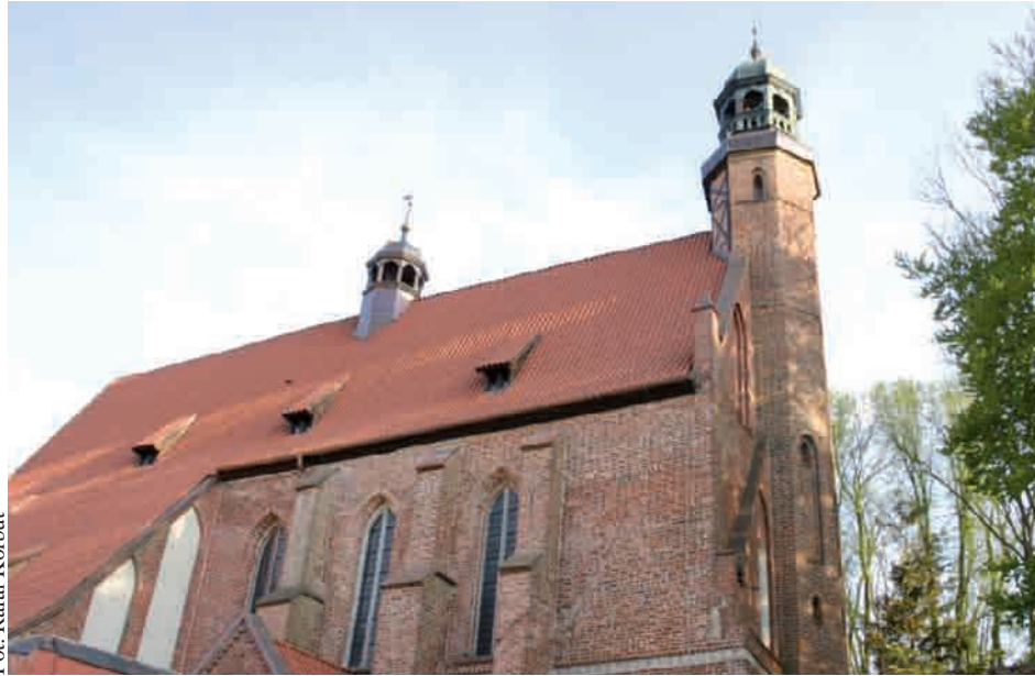
Największą dotację – 100 tys. zł – otrzyma parafia w Żukowie

Kolejnym zabytkiem, który będzie w tym roku dotowany, jest kartuska kolegiata. 60 tys. zł zostanie w tym roku przeznaczone na drugi etap remontu i prac konserwatorskich w jednym z zachowanym eremie. Kolegiata