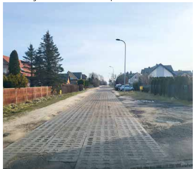
Ul. Pszenną w Baninie czeka metamorfoza, wkrótce przetarg