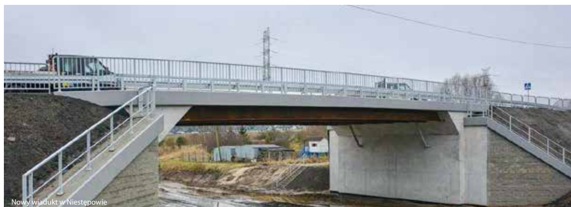
Nowy wiadukt w Niestępowie

W roku 2022 Władze Powiatu Kartuskiego dokonały uroczystego otwarcia nowego wiaduku w Niestępowie. Realizacja budowy tak długo oczekiwanego wiaduku trwała zaledwie 5 miesięcy i była możliwa jedynie przy wsparciu środków zewnętrznych. Zarząd Powiatu Kartuskiego otrzymał na to zadanie dofinansowanie z Ministerstwa Infrastruktury. Wspólna Komisja Rządu i Samorządu działająca w Ministerstwie Infrastruktury z rezerwy subwencji ogólnej przyznała Powiatowi Kartuskiemu dofinansowanie na zadanie: - Rozbiórka istniejącego