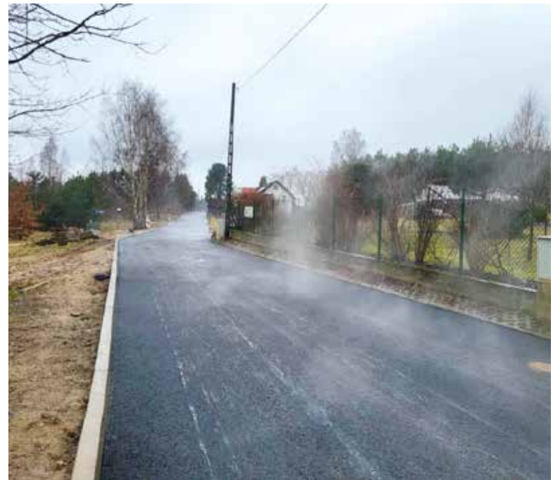
Nowa nawierzchnia asfaltowa - Borkowo ul. Głęboka