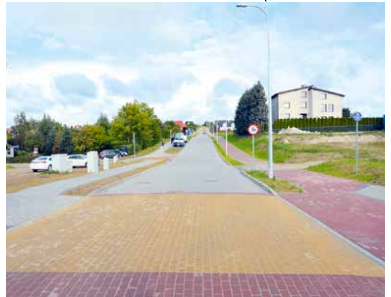
Ul. Batorego w Żukowie. Wkrótce II etap zadania