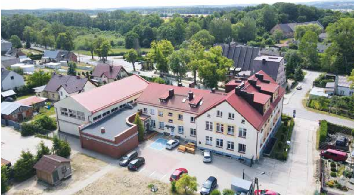
Szkola w Leźnie będzie rozbudowana

GINA ŻUKOWO | Na inwestycje w gminie Żukowo przeznaczono ok. 109 mln zł, w 2024 roku! Ogromną rolę będą pełnić liczne dofinansowania, które w znacznym stopniu odciążą gminny budżet.