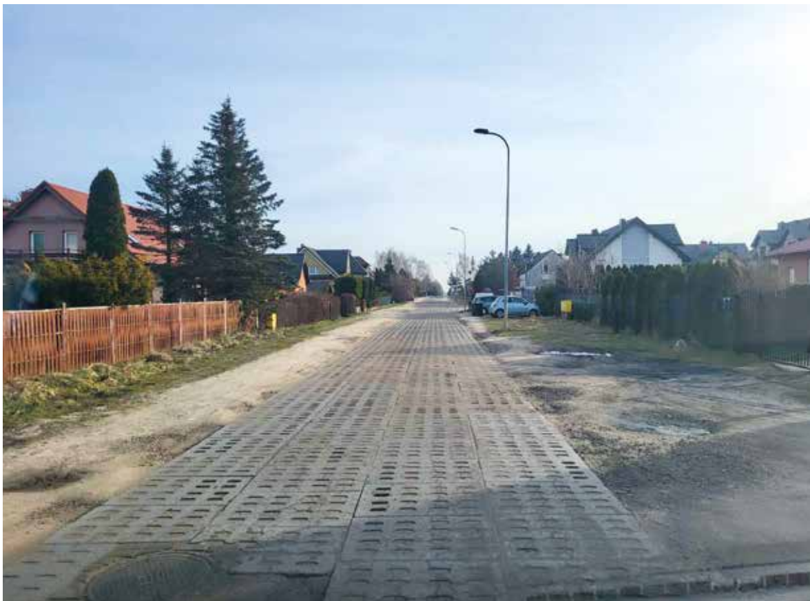
ul. Pszennej w Baninie