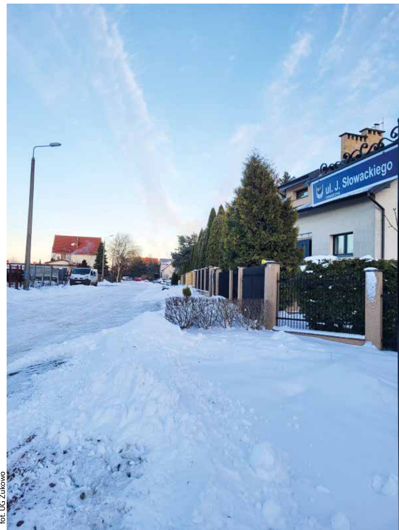
ul. Słowackiego w Chwaszczynie