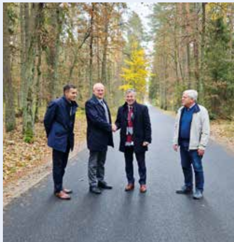
UŁC Starostwo Powiatowe w Kartuzach