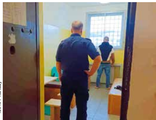
for: KPP Kartuzy

POWIAT | Zatrzymaniem mieszkańca powiatu kartuskiego zakończyła się policyjna kontrola drogowa. 35-letni pasażer miał przy sobie narkotyki, a kierowca jechał pomimo dożywotniego zakazu prowadzenia pojazdu.