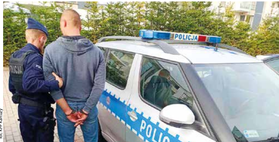
for: KPP Kartuzy

POWIAT | W ciągu kilku dni kartuscy policjanci zatrzymali cztery osoby poszukiwane, które dopuściły się różnych czynów. Mężczyźni trafili już do więzienia, gdzie będą odbywać kary pozbawienia wolności.