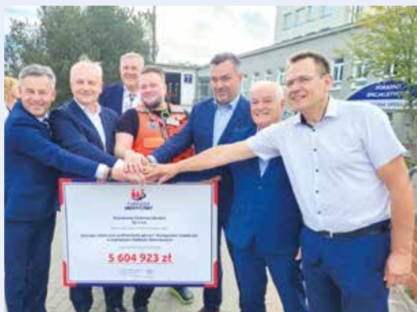
fol. Starostwo Powiatowe w Kartuzach

Środki pochodzą z subfunduszu modernizacji podmiotów leczniczych wyodrębnionego z Funduszu Medycznego. Termin