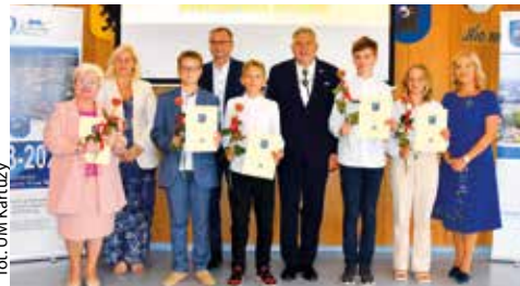
for. UM Kartuzy

KARTUZY | Odkonano wręczenie listów gratulacyjnych dla uczniów, którzy w ubiegłym roku szkolnym uzyskali najwyższe średnie i przyznano im Stypendium Burmistrza Kartuz.