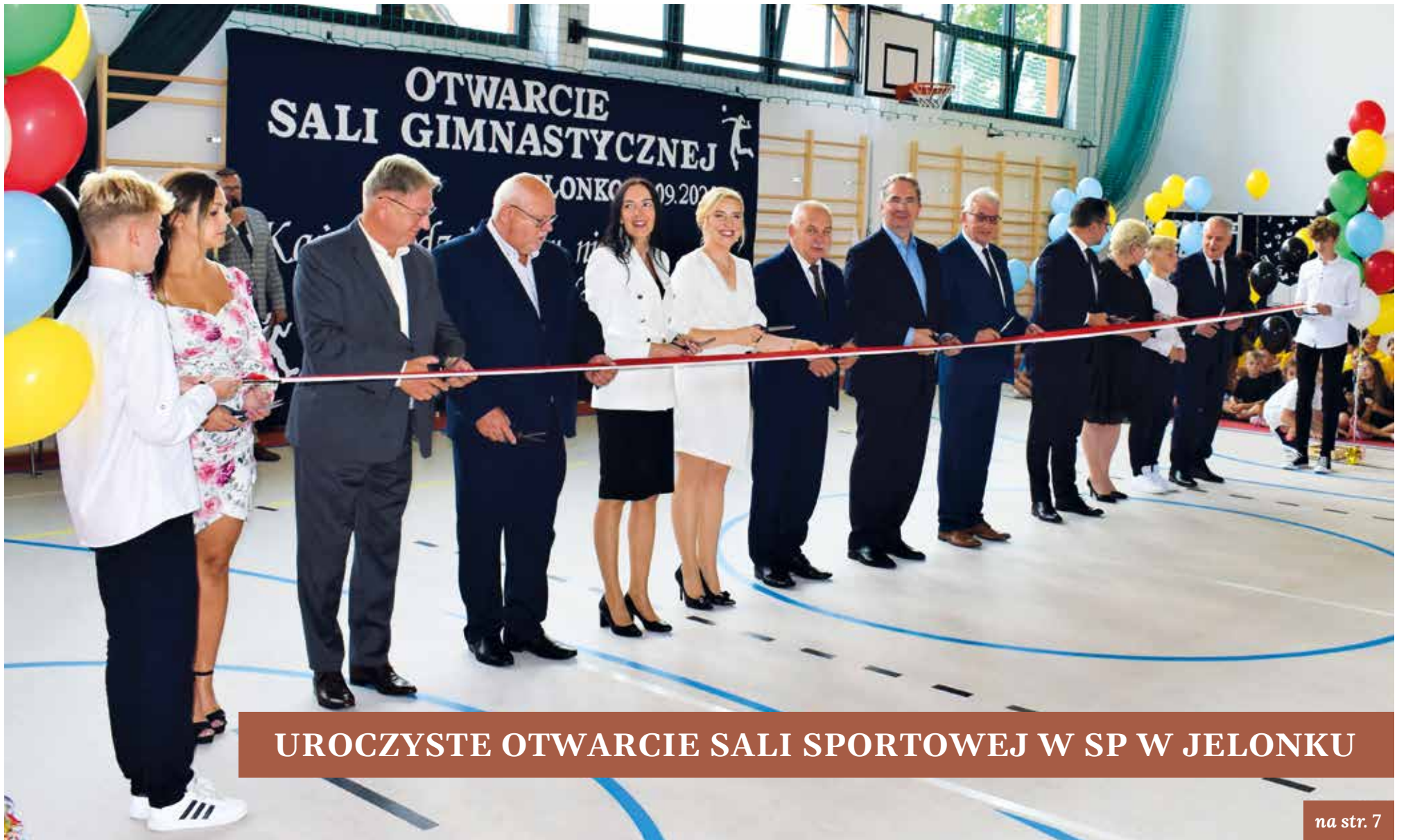
UROCZYSTE OTWARCIE SALI SPORTOWEJ W SP W JELONKU

DOWIEDZ SIĘ WIĘCEJ NA STRONIE WWW.EXPRESSBIZNESU.PL