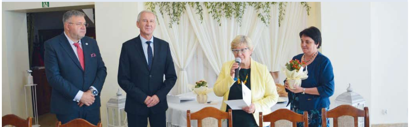
fol. Starostwo Powiatowe w Kartuzach

POWIAT | Międzynarodowy Dzień Białej Laski to święto osób niewidomych i niedowidzących. Dzień, w którym przypominają zdrowej części społeczeństwa, że są takimi samymi obywatelami kraju i świata jak wszyscy inni ludzie.