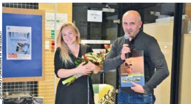
Starostwo Powiatowe w Kartuzach

POWIAT | Sala wypełniła się po brzegi. Autorka opowiadała o kulisach swojej twórczości i życiu prywatnym.