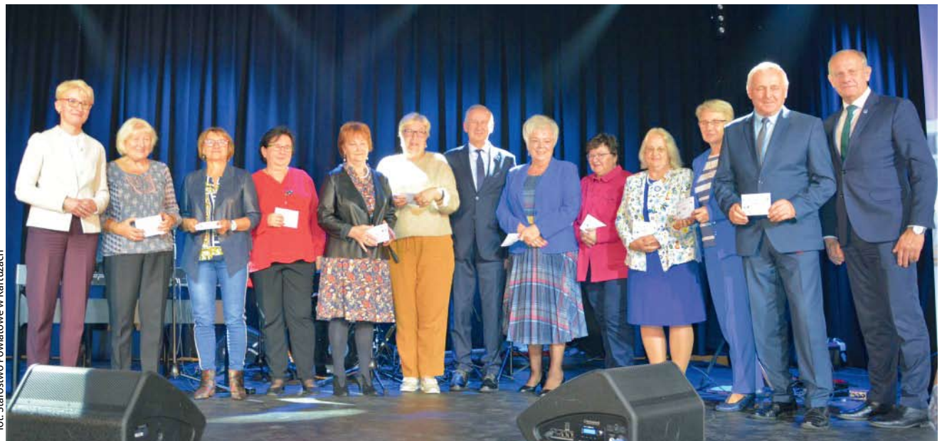
fol. Starostwo Powiatowe w Kartuzach

POWIAT | Inauguracja działalności Uniwersytetu Trzeciego Wieku przyniosła seniorom dużo radość. Przed nimi ciekawe zajęcia i nowe znajomości.