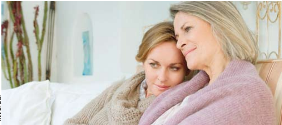
fol. Mat. pras.

SIERAKOWICE, STĘŻYCA | W ślad za ogólnopolską kampanią promocyjną Ministerstwa Zdrowia pn. „Planuję Długie Życie” w Sierakowicach, Stężycy będzie można wykonać bezpłatne badania mammograficzne.