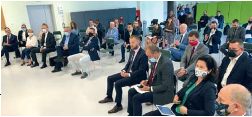
for. Mat. pras.

POWIAT | Nowa linia PKM ma powstać w południowej części Obszaru Metropolitalnego Gdańsk-Gdynia-Sopot. Koncepcja już jest.