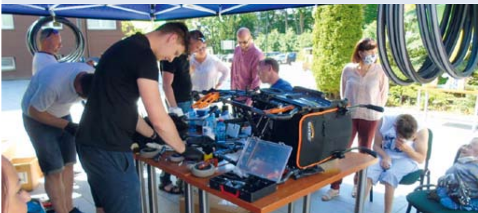
fol. Powiat kartuski

POWIAT | Ciekawą i z pewnością przydatną osobom niepełnosprawnym akcją zorganizowano na placu przy Starostwie Powiatowym w Kartuzach. Niepełnosprawni mogli sprawdzić stan techniczny swoich wózków i skorzystać z pomocy specjalistów.