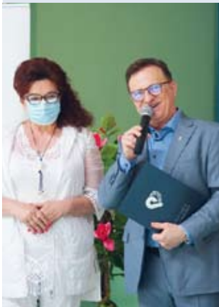
fol. UG Przdokowo

GM. PRZODKOWO | Najzdolniejsi uczniowie zostali nagrodzeni przez wójta. Uehonorowani zostali także nauczyciele, muzycy, a także osoby zaangażowane społecznie.