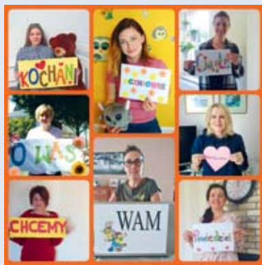
fot. Nauczyciele z SP w Przodkowie

Nauczyciele ze Szkoły Podstawowej w Przodkowie postanowili wyrazić tęsknotę oraz wesprzeć swoich uczniów w tym trudnym dla wszystkich czasie. Dlatego zrobili sobie zdjęcia, na których trzymają wypisane hasła skierowane do uczniów oraz wycięte z papieru serduszka. - Kochani uczniowie! Mamy nadzieję, że szybko czas pandemii minie i już wkrótce będziemy mogli się spotkać w szkolnych murach – zwrócili się do dzieci nauczyciele z SP w Przodkowie. - Tymczasem serdecznie Was ściskamy i życzymy dużo zdrowia. /UGP/