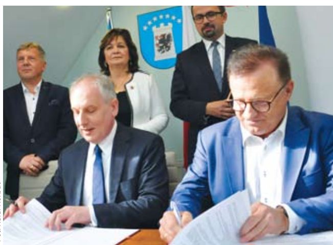
Fot. Rafał Korbut