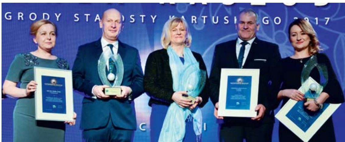
Laureaci Superperły Kaszub 2017: firma Gosz z Sierakowic, Gospodarstwo Agroturystyczne „U chłopca” z Chmielna oraz firma Wibo z Kartuz

jest tak dobrze oceniany na arenie krajowej. Trzeba także pamiętać, że nagradzani (a są to ludzie wyróżniający się twórczymi i ciekawymi pomysłami, wspierający osoby niepełnosprawne, inwestujący w rozwój sportu, finansujący wiele przedsięwzięć z własnych pieniędzy) to osoby skromne, którzy nie robią tego wszystkiego, aby zyskać rozgłos czy sławę. Nie chcą się afiszować z działaniami. My – wręczając im Perły Kaszub – mamy docenić ich ogromne zaangażowanie i wpływ na rozwój. Warto dodać, że takich ludzi, którzy zasługują na honory, jest naprawdę wielu - samych nominacji tylko w tegorocznej edycji było ponad 70. W od początku istnienia plebiscytu zgłoszonych zostało natomiast ponad 900 osób! To pokazuje, ilu mieszkańców powiatu kartuskiego chce się dzielić z innymi swoim czasem, odczuwając z tego radość i satysfakcję, i mieć realny wpływ na zmianę życia społecznego na lepsze.