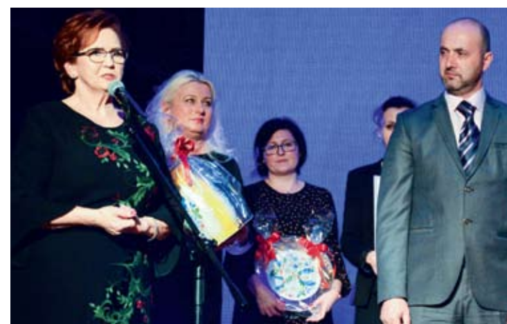
Goście ZE Śniatynia (Ukraina)