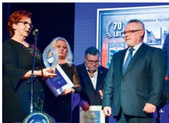
Perła dla Gminnej Spółdzielni „Samopomoc Chłopska” z Sierakowic