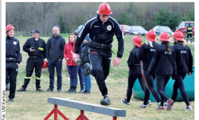
STRAŻACY-OCHOTNICY ZMIERZYLI SIĘ PODCZAS ZAWODÓW W MIRACHOWIE