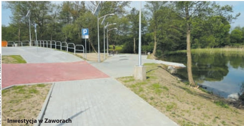
Inwestycja w Zaworach

Zakończono więc przebudowę drogi w Zaworach (w ramach projektu „Rozbudowa i zabezpieczenie szlaku wodnego Kółka Raduńskiego poprzez udrożnienie przepływu pomiędzy jeziorami Kłodno i Brodno Małe wraz z infrastrukturą towarzyszącą”). Wybudowano nowy most, który umożliwi swobodny przepływ łódkami, kajakami oraz mniejszymi żaglówkami, wzdłuż powstała ścieżka pieszo-rowerowa, w obrębie mostu slip do wodowania, miejsca postojowe wyposażone w stoły, ławki, kosze na śmieci, całość oświetlona lampami solarnymi.