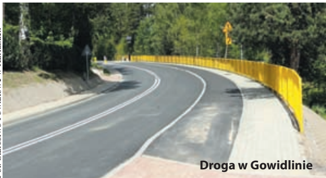
Droga w Gowidlinie