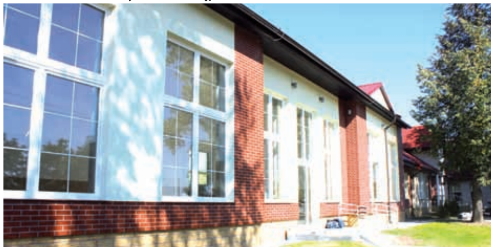
Budowa auli przy szkole podstawowej w Borkowie