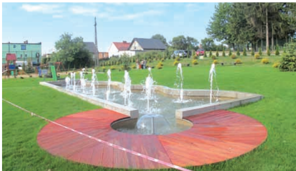
Fontanna i plac zabaw w Przodkowie