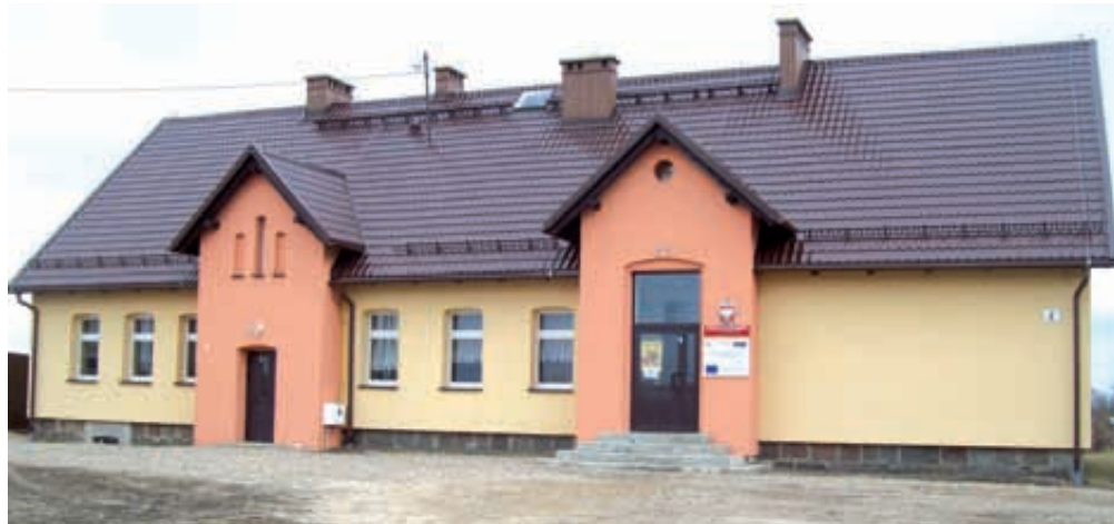
Termomodernizacja budynku SP w Wilanowie