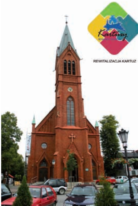
Jaki będzie kierunek zmian w Kartuzach w przyszłości? Rozmowy i konsultacje w tej sprawie trwają

Przypominamy, że uchwalenie Lokalnego Programu Rewitalizacji Kartuz pozwoli osiągnąć po środki unijne przewidziane na ten cel w Regionalnym Programie Operacyjnym dla Województwa Pomorskiego na lata 2014-2020. Rafał Korbut