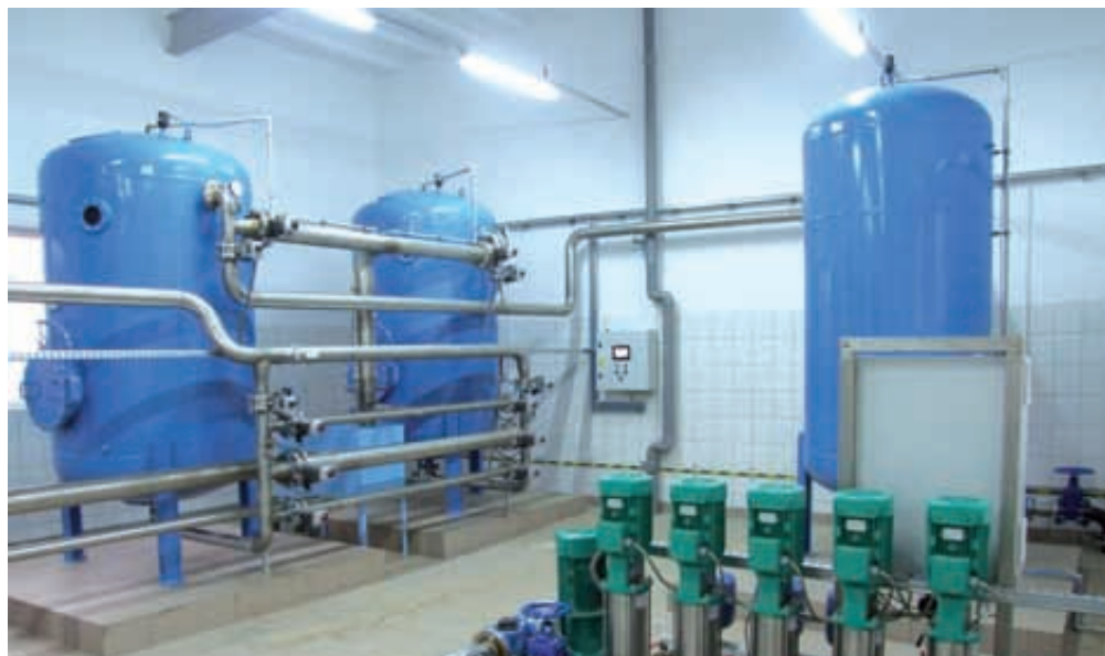
Stacja uzdatniania wody w Kobysewie

- modernizacja ujęcia wody wraz z rozbudową sieci wodociągowej w Kobysewie poprzez wykonanie 1 km sieci wodociągowej z uzbrojeniem, pełną termomodernizację budynku istniejącej