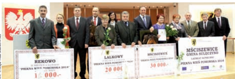
Na zdjęciu laureaci konkursu „Piękna Wieś Pomorska 2014”

Główną ideą konkursu „Piękna Wieś Pomorska” jest poprawa estetyki i stanu środowiska pomorskich wsi i zagród oraz wyróżnie-