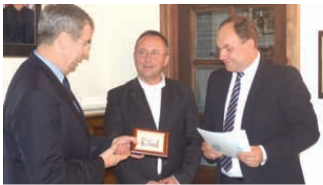
Dofinansowanie umożliwi rozpoczęcie realizacji tej niezwykle ważnej dla gminy inwestycji

Teren na którym ma być realizowana inwestycja, to teren funkcjonującej oczyszczalni ścieków. Obecna przepustowość oczyszczalni będącej przedmiotem projektu wynosi wg pozwolenia wodno – prawnego Q śrd = 520 m 3 /dobę, a ścieki odprowadzane są do rzek Kani położonej w bezpośrednim sąsiedztwie oczyszczalni, należącej do zlewni rzeki Wdy. Obecna