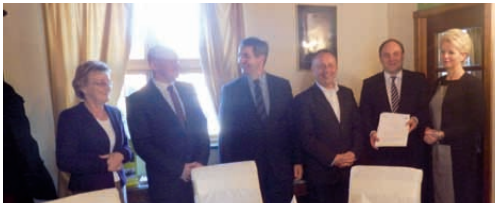
Gmina Stężyca otrzyma aż 8 mln zł na budowę nowej oczyszczalni ścieków

- Budowie komunikacji wewnętrznej oraz przyłączy: wodociągowego, elektroenergetycznego, sieci