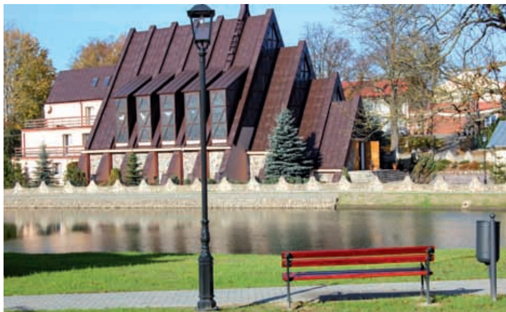
Uporządkowanie i zagospodarowanie centrów wsi w gminie Żukowo: Leżno, Glinicz, Chwaszczyno, Sulmin, Pępowo, Banino.