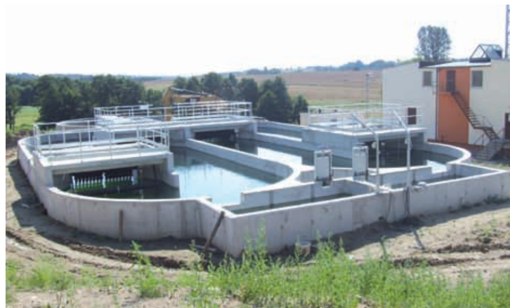
Budowana oczyszczalnia ścieków w Przdokowie

Przed nami kolejne wyzwania do realizacji, które szczegółowo opisane zostały w Strategii Rozwoju Gminy na lata 2012-2020. Tylko od nas wszystkich – mieszkańców gminy – zależeć będzie czy wszystko w niej zapisane zostanie zrealizowane.