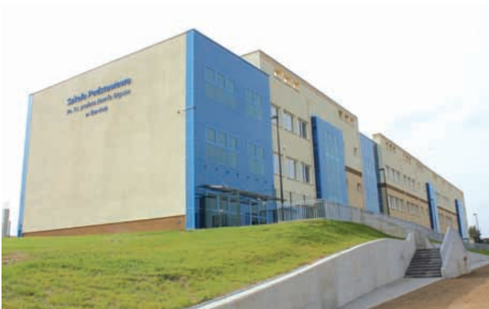
Szkola w Baninie pomieści nawet 900 uczniów