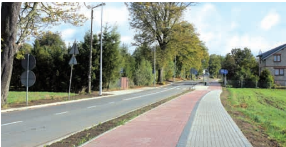
Budowa ulicy Armii Krajowej w Pępowie i Żukowie