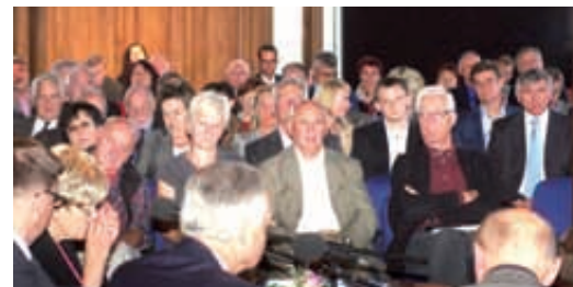
Publiczność licznie przybyła na promocję książki