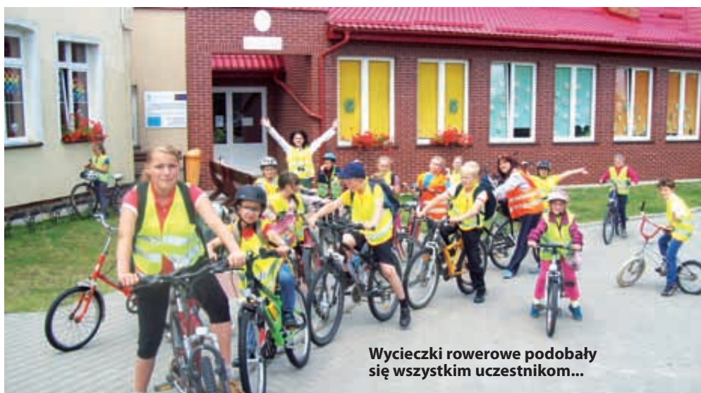
Wycieczki rowerowe podobały się wszystkim uczestnikom...