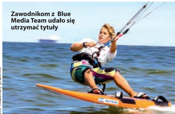
Zawodnikom z Blue Media Team udało się utrzymać tytuły

- To była naprawdę elektryzująca rywalizacja, za którą ogromnie dziękuję Błażejowi. Musiałem się mocno zmo-