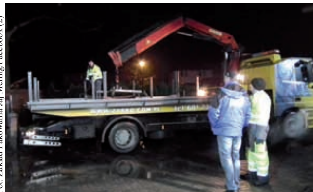
Ogromna patelnia jest przygotowana do usmażenia największej na świecie jajecznicy

KARTUZY | To będą trzy dni zabawy, rozrywki, świetnej muzyki i znakomitego jedzenia. W Kartuzach odbędą się Dni Kultury Kaszubskiej. Jednym z najciekawszych wydarzeń będzie bicie rekordu Guinnessa.