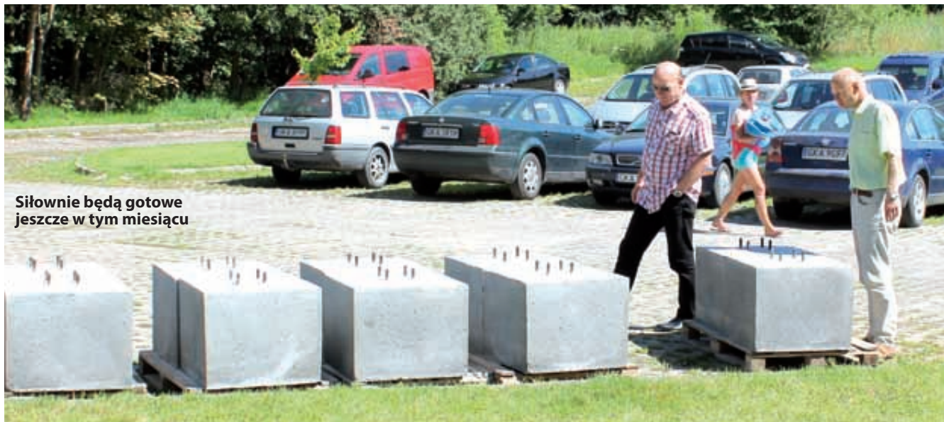
Siłownie będą gotowe jeszcze w tym miesiącu

W zestawach znajdują się przyrządy pn. biegacz i orbitrek, prasa nożna i wioślarz, wyciąg górny i krzesło do wyciskania, twister i stepper. Przyrządy będą ogólnodostępne dla wszystkich użytkowników mieszkańców i turystów. Obecnie trwają przygotowania do montażu. Na plac budowy przywieziono solidne podstawy betonowe, do których przymocowane zostaną przyrządy do ćwiczeń. Urządzenia zostaną oddane do użytku do 31 lipca br. Jest to kolejna inwestycja przygotowana dla mieszkańców i turystów, zachęcająca do aktywnego, zdrowego trybu życia i wypoczynku. Dostawcą urządzeń jest firma PPUH "ZAMA" z Torunia. Całkowity koszt inwestycji wraz z montażem urządzeń to niemal 74 tys. zł brutto. Inwestycja zostanie dofinansowana ze środków unijnych w wysokości 50 tys. zł.