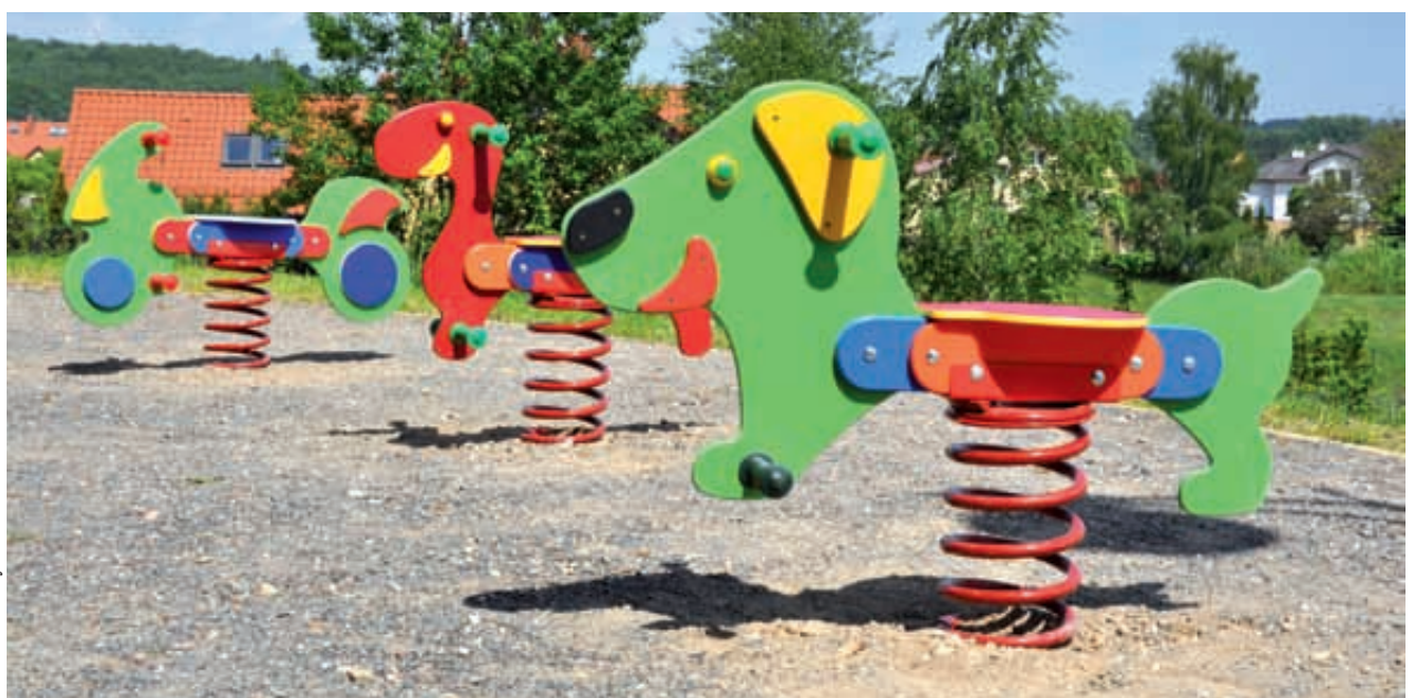
Fot. UM Kartuzy