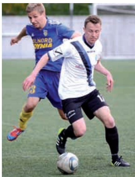
TABELA III LIGI BAŁTYCKIEJ:

Cartusia ma cztery punkty przewagi nad 11 w tabeli Pomorzem Potęgowa i dwa oczka nad zajmującą 10 miejsce Lechią II Gdańsk