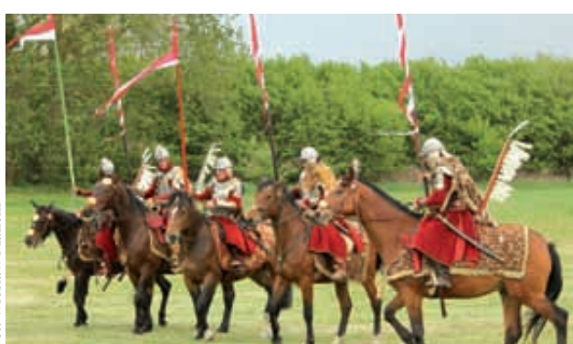
Popisy husarii