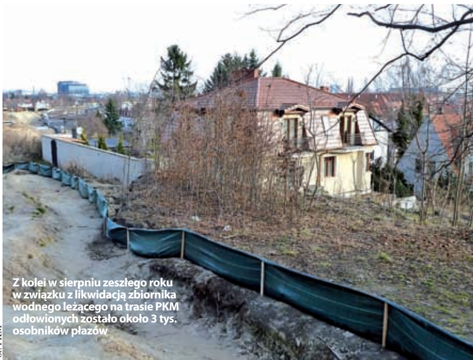
Z kolei w sierpniu zeszłego roku w związku z likwidacją zbiornika wodnego leżącego na trasie PKM odłowionych zostało około 3 tys. osobników płazów

Zapobiegają one rozjeżdżaniu płazów, które właśnie rozpoczęły migrację. Płazy są następnie odławiane i bezpiecznie przenoszone poza zasięg inwestycji. Dodatkowo temperatury oraz opady deszczu przyczyniły się do rozpoczęcia migracji płazów, które w celach rozrodczych przechodzą z miejsc, gdzie spędziły zimę do zbiorników wodnych. Niektóre szlaki ich wędrówki przecinały teren inwestycji oraz drogi dojazdowe do budowy Pomorskiej Kolei Metropolitalnej. Żeby zapewnić im bezpieczne przejście tereny te zostały zabezpieczone tymczasowymi wygradzzeniami. Tylko do końca marca ustawiono ponad 1,7 km płotków m.in. w rejonach ul. Gomółki, zbiornika retencyjnego Jasień, zbiornika retencyjnego Kielpiniek oraz ul. Świąteczkiej.