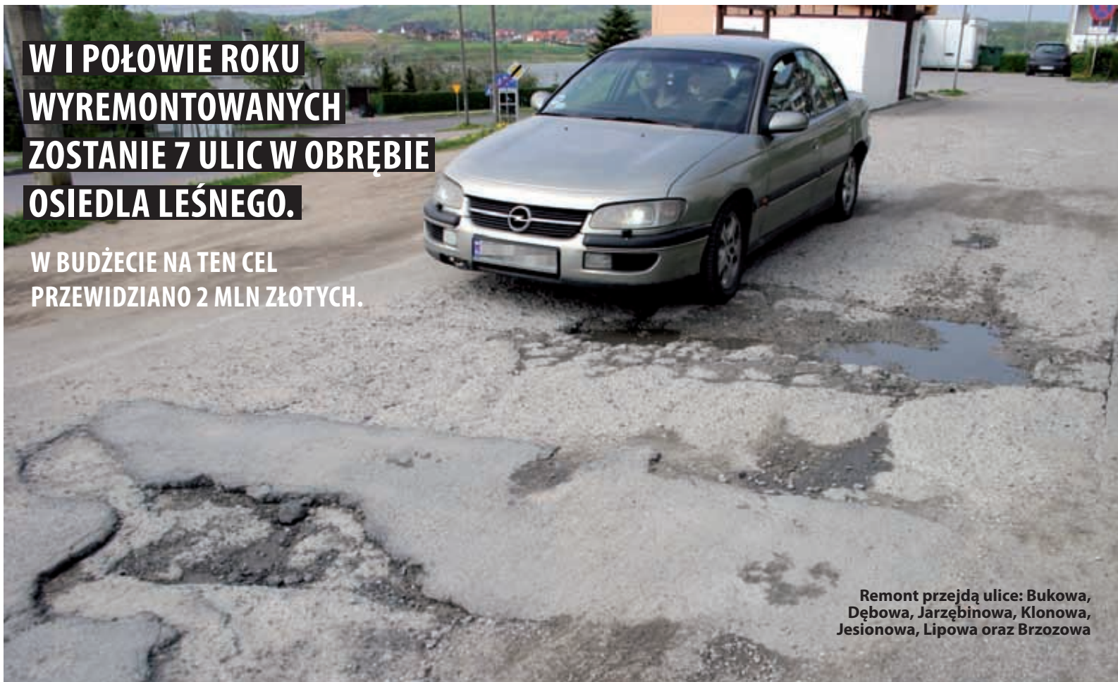
Remont przejdą ulice: Bukowa, Dębowa, Jarzębinowa, Klonowa, Jesionowa, Lipowa oraz Brzozowa

W BUDŻECIE NA TEN CEL PRZEWIDZIANO 2 MLN ZŁOTYCH.