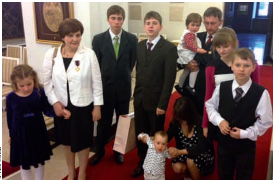
Program „Rodzina +” jest skierowany do rodzin wielodzietnych

- Planujemy zakup pralek klasy A+++ o pojemności 8 kg, z różnymi funkcjami