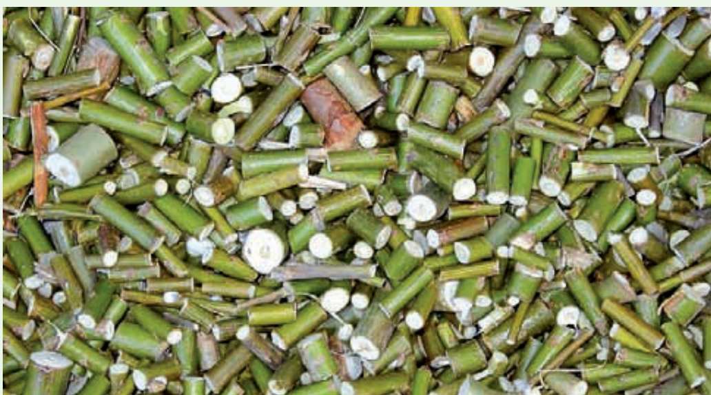
Na zdjęciu zrębki wierzby energetycznej. Właśnie taka biomasą będzie paliwem lęborskiej elektrociepłowni

Budowa elektrociepłowni opalanej biomasą (m.in. odpady przemysłu drzewnego) to temat, o którym w Lęborku można było usłyszeć już w 2011 roku. Kilka lat trwały ustalenia związane z realizacją inwestycji i jej finansowaniem, kłopoty z wyborem wykonawcy opóźniły rozpoczęcie budowy o kilka miesięcy. Bo pierwotnie jako najkorzystniejsza w przetargu została wybrana oferta gliwickiej spółki Energo-technik-Ennergorozruch. Jednak finalnie – po dwóch odwołaniach do KIO - zlecenie pozyskało konsorcjum firm Polytechnik Luft- und Feuerungstechnik GmbH, Weissenbach i Polytechnik Polska Sp. z o.o. z Gdyni. Ta polska firma specjalizuje się w projektowaniu, montażu i budowie instalacji kotłowych (także na biomasę) "pod klucz" i zrealizowała już kilkadziesiąt takich instalacji w całym kraju.