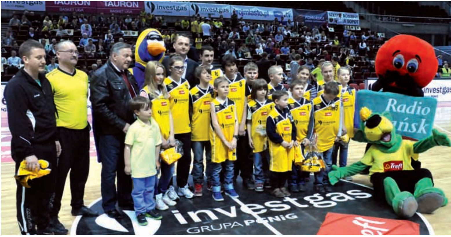
Trefl Sopot i investgas