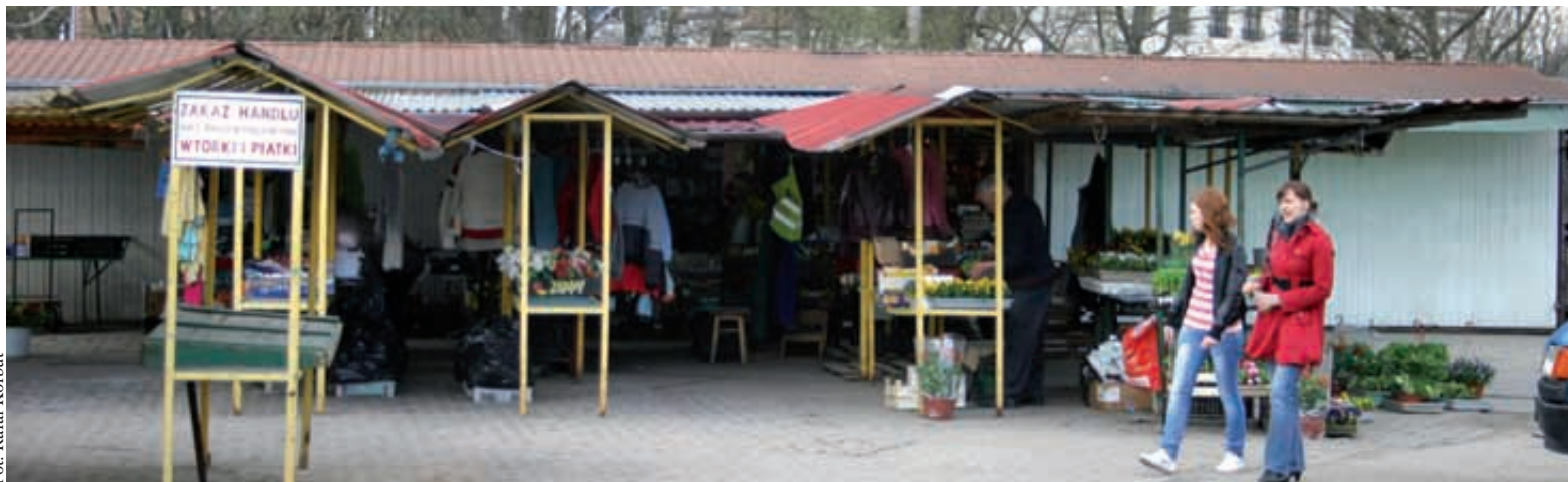
Wciąż nie wiadomo, jak ostatecznie będzie wyglądać targowisko w Kartuzach

„KARTUZY | Wciąż trwa dyskusja na temat przyszłości targowiska znajdującego się nieopodal dworca autobusowego w Kartuzach. Burmistrz miasta zaproponowała, aby powstały tam pawilony, zadaszone stoły i miejsca do sprzedaży bezpośrednio z samochodów.”