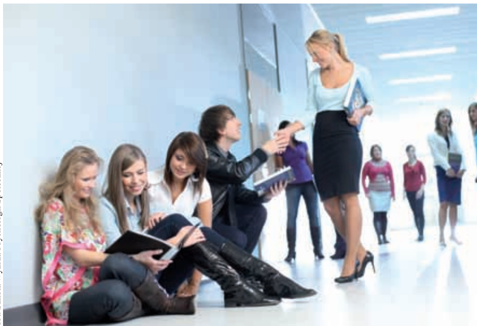
fol. Szkoła Wyższa Psychologii Społecznej

Ankieterzy zapytają ponadto między innymi o to, jakie badania mają doświadczenia związane z edukacją, jak warunki społeczno-ekonomiczne wpływają na poglądy i zachowania Polaków dotyczące uczenia się. Dlaczego na przy-