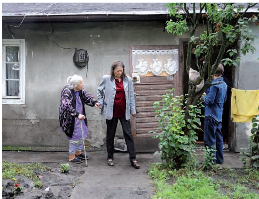
Woda w domu 91-letniej mieszkanki osiedla sięgała blisko pół metra