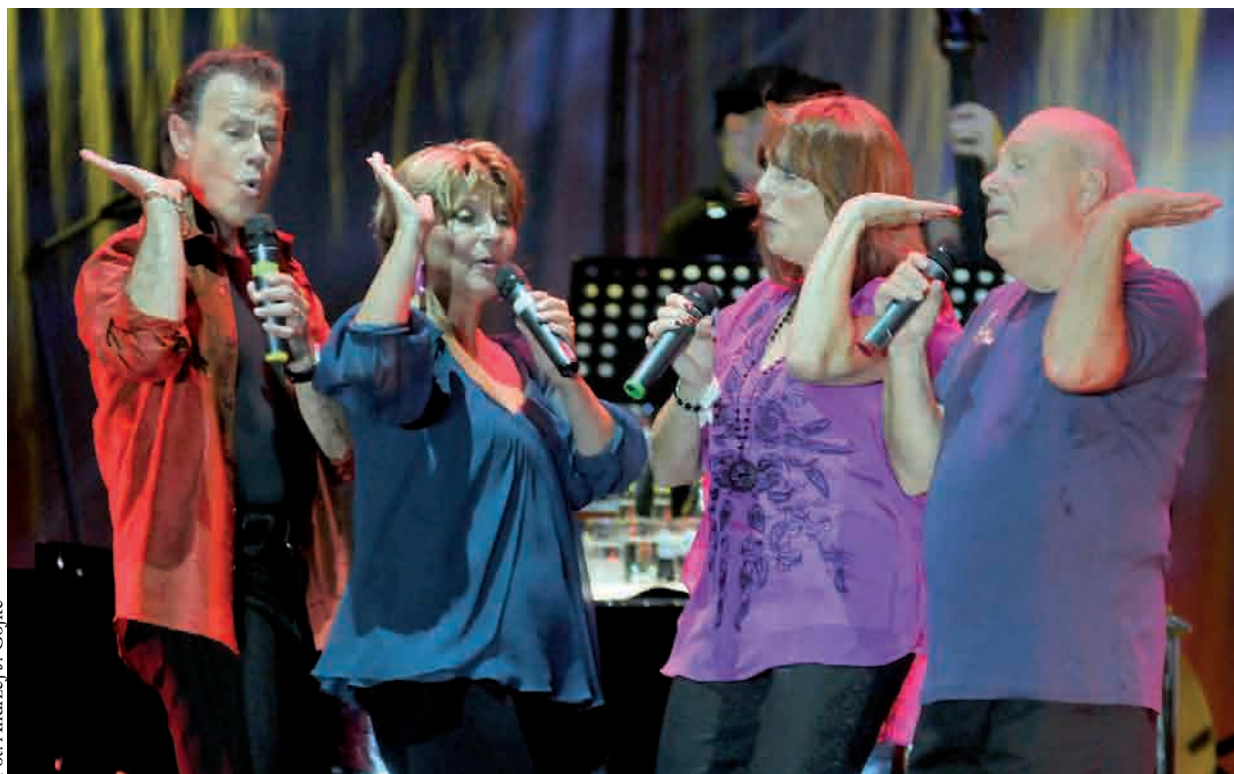
Gwiazdą ubiegłorocznego Ladies jazz Festival była legendarna grupa The Manhattan Transfer

Jutro w Teatrze Muzycznym im. Danuty Baduszkowej w Gdyni rozpoczyna się 7 edycja Ladies Jazz Festival. Wśród gwiazd tegorocznej imprezy znalazły się grupa Incognito, Brenda Boykin featuring Club des Belugas, Frederika Stahl, a także mieszkająca na stałe za oceanem Grażyna Auguścik w duecie z gitarzystą Paulinho Garcia.