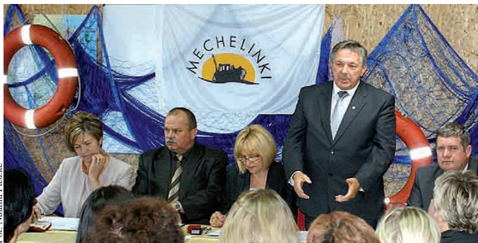
Podczas podpisania umowy w Mechelinkach

Na projekt gmina otrzymała 14,5 miliona dofinansowania. 15 lipca br. odbyła się nadzwyczajna sesja Rady Gminy Kosakowo, zwołana w celu rozpatrzenia projektu uchwały w sprawie uchwalenia i przyjęcia do realizacji programu gospodarczego „Zagospodarowanie przystani rybackiej w Mechelinkach” w ramach Programu Operacyjnego „Zrównoważony rozwój sektora rybołówstwa i nadbrzeżnych obszarów rybackich” 2007-2013. Podczas sesji radni jednogłośnie przyjęli projekt uchwały.