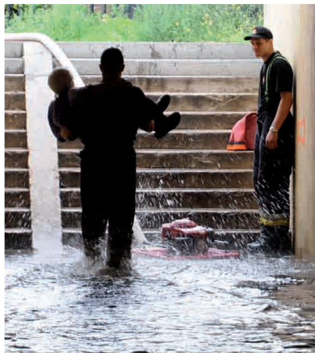
Zanim wypompowano wodę z tunelu strażacy przynosili chęć tamtędy przejść starsze osoby na rękach