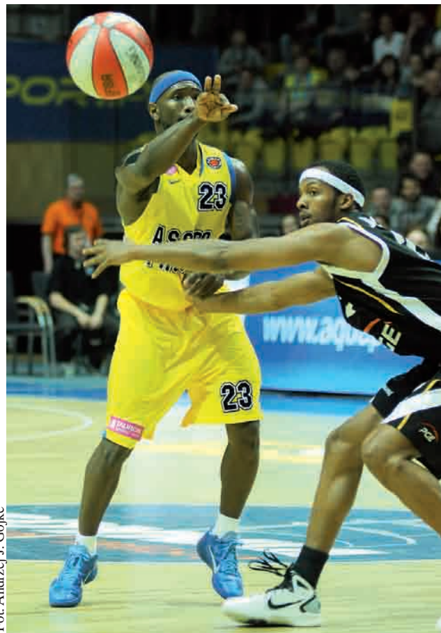
Zawodnicy Asseco Procom będą losowani z czwartego koszyka

Uczestnicy campu trening z polskim jedynakiem w NBA odbędą w Hali Sportowo-Widowskiej Gdynia 20 lipca. Formularze zgłoszeniowe dostępne są na stronie fundacji Marcina Gortata MG13 www.mg13.com.pl .