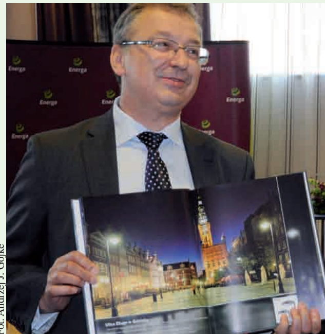
Nasze lampy od kilku lat świecą na gdańskiej starówce i jeszcze, żadna przez ten czas nie musiała być wymieniona

pła. Grupa ENERGA dostarcza energię elektryczną dla 2,5 mln gospodarstw domowych oraz do ponad 300 tys. firm, co daje jej około 17-procentowy udział w rynku sprzedaży energii elektrycznej. Grupa jest operatorem systemu dystrybucyjnego energii elektrycznej na obszarze 75 tys. km kw. i eksploatuje ponad 187 tys. km linii elektrycznych, którymi przesyła ponad 20 TWh energii rocznie. Jest też krajowym liderem w dostawie energii ze źródeł odnawialnych. Grupa ENERGA posiada 45 elektrowni wodnych. Do jej sieci przyłączone są liczne elektrownie wiatrowe, małe elektrownie wodne i biogazownie. Grupa odgrywa również wiodącą rolę na krajowym rynku sprzedaży praw majątkowych do świadectw pochodzenia ze źródeł odnawialnych. Aż 14 procent energii elektrycznej dostarczanej przez ENERGA do jej klientów pochodzi ze źródeł odnawialnych. Royal Philips Electronics jest