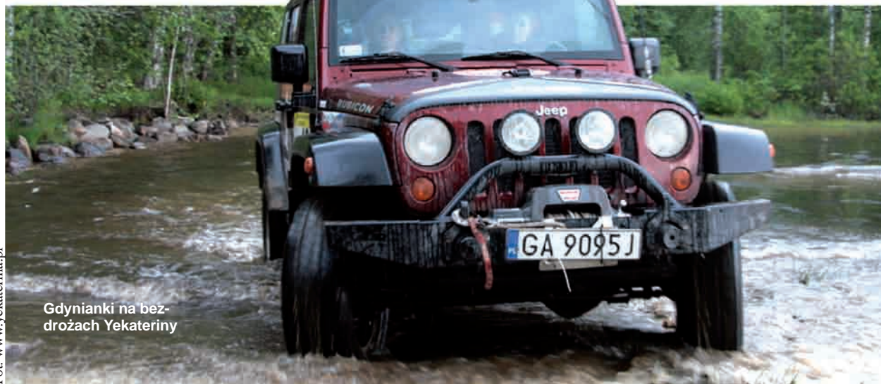
Gdynianki na bezdrożach Yekateriny

Wystawa w Tyglu, jest fragmentem większej kolekcji prac artysty, zatytułowanej „KRAĄG”