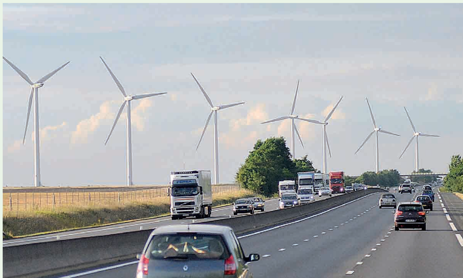
1 GW energii wytwarzanych jest w naszym kraju przez turbiny wiatrowe