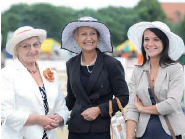
Zgodnie z sugestiami organizatora większość pań przybyła na imprezę w eleganckich kapeluszach

GALA | W pierwszym dniu Międzynarodowych Oficjalnych Zawodów w skokach CSIO, odbywających się w miniony weekend na sopockim hipodromie, miało miejsce bezprecedensowe wydarzenie. Była nim pierwsza Letnia Gala Biznesu, podczas której nagrodzono najwybitniejszych menadżerów ostatnich lat.