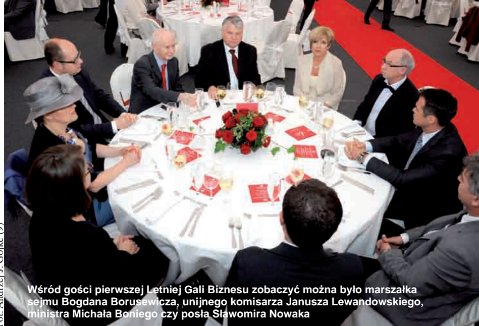
Wśród gości pierwszej Letniej Gali Biznesu zobaczyć można było marszałka sejmu Bogdana Borusewicza, unijnego komisarza Janusza Lewandowskiego, ministra Michała Boniego czy posła Sławomira Nowaka

Podczas Gali pomorscy przedsiębiorcy nagrodzili największe i najbardziej spektakularne biznesowe sukcesy minionych miesięcy i lat. Wręczono trzy