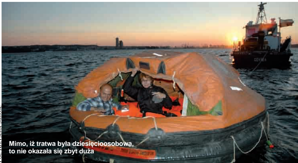
Mimo, iż tratwa była dziesięcioosobowa, to nie okazała się zbyt duża