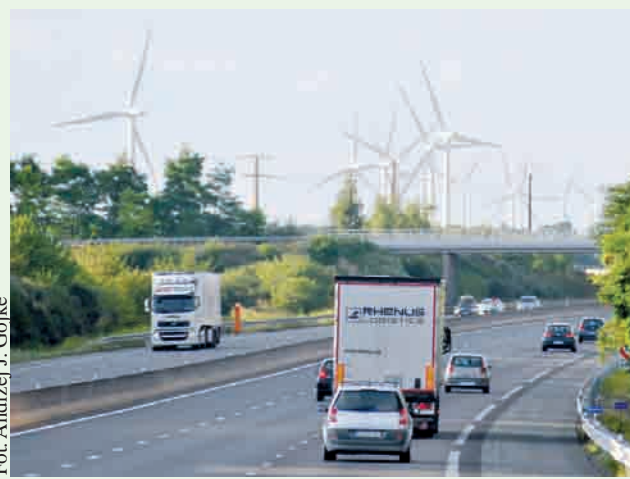
Ekologiczny efekt rozwoju energetyki wiatrowej też jest poddawany pod wątpliwość - wiatraki ze względu na imponujące rozmiary szpecą krajobraz i stanowią zagrożenie dla ptaków