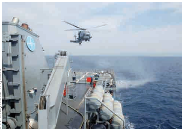
Podczas Ćwiczeń na Morzu Śródziemnym