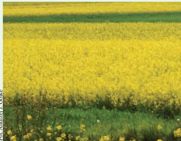
Alternatywą dla oleju napędowego jest olej roślinny uzyskiwany np. z rzepaku