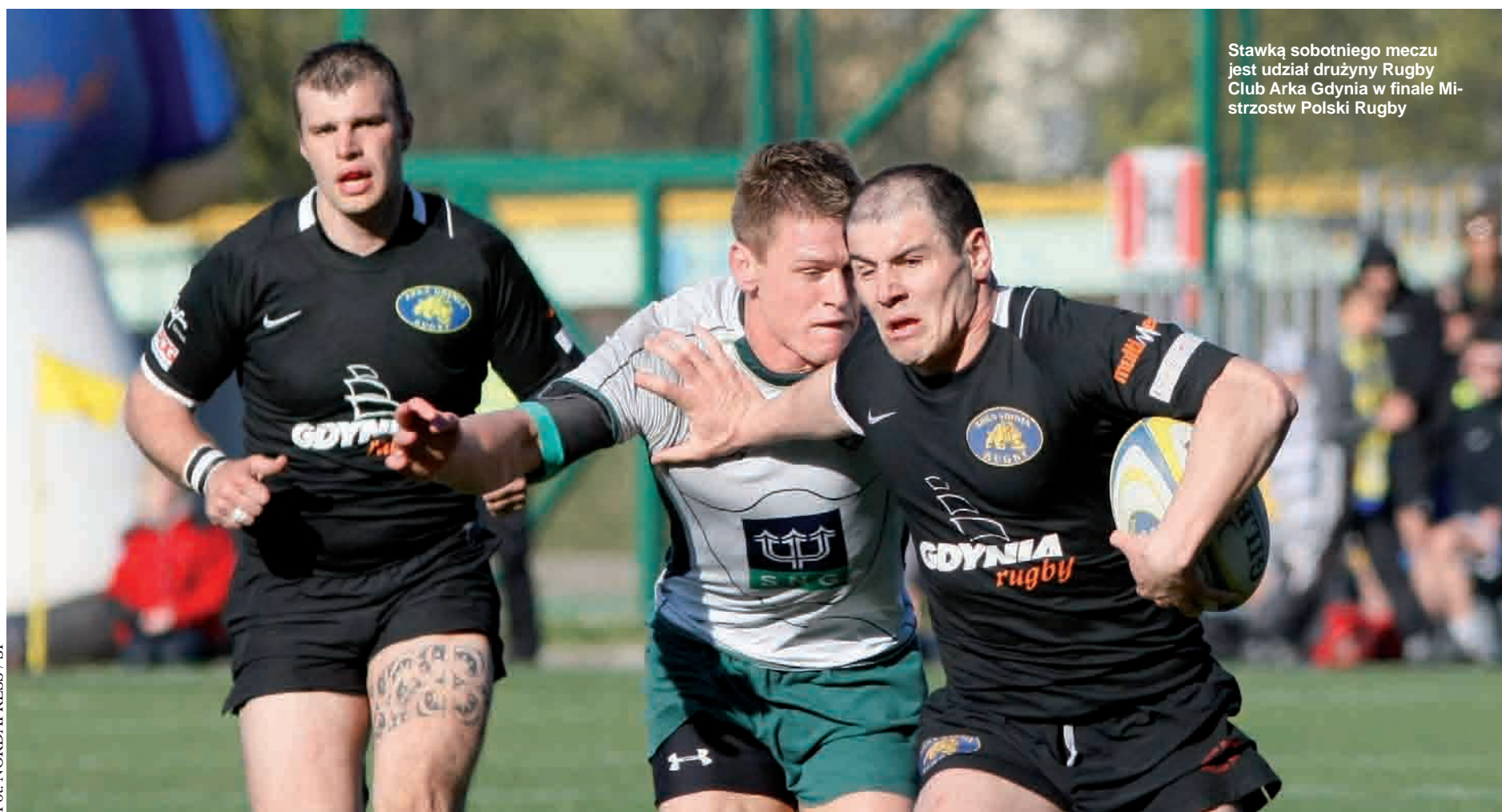
Stawką sobotniego meczu jest udział drużyny Rugby Club Arka Gdynia w finale Mistrzostw Polski Rugby