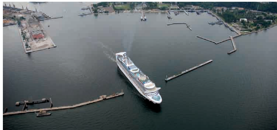
Star Princess- jeden z największych „pasażerów”, jakie zawijały do Gdyni

Pierwszym statkiem wycieczkowym w tym sezonie będzie 13 maja Princess Daphne pływający pod banderą Portugalii. Wśród statków znanych z poprzednich lat zobaczymy w tym sezonie w Gdyni m.in.: uhonorowane w ubiegłym roku tablicami w Alei Statków na Nabrzeżu Pomorskim kolosa AIDA blu (252 m) i Vision of the Seas (279 m). Największa pod względem długości (290,20 m), której trzykrotne zawinięcie jest już potwierdzone, to wybudowana w przed dwoma laty Costa Pacifica. Po raz pierwszy wspaniałego kolosa zobaczyć będzie można w Gdyni 27 maja. Kolorowe, inspirowane muzyką, wnętrza, dostarczają pasażerom Costa Pa-