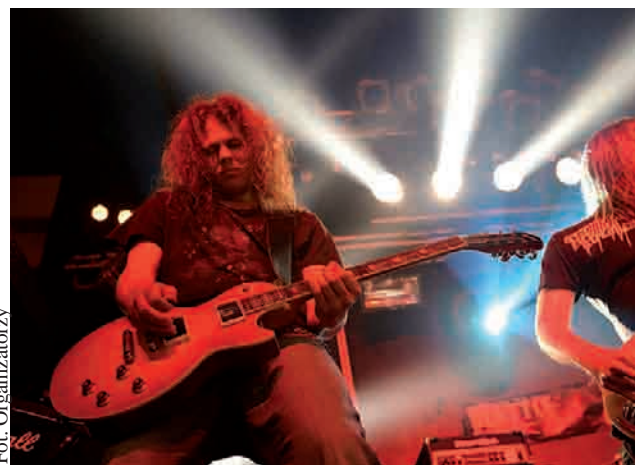
(tm) Zagrają Clockwise, Madseed oraz Buck Pyro i Wolf Tank Crew

cią naturalna. Wraz z Tribute to Seattle 2008 powstała idealna szansa by kultywować tradycję i przywrócić idee do życia. Zespół Snails korzystając z doświadczenia, jakie zdobył przy okazji TTS 2003, wspólnie z innymi młodymi zespołami podjął się tego trudnego zadania.