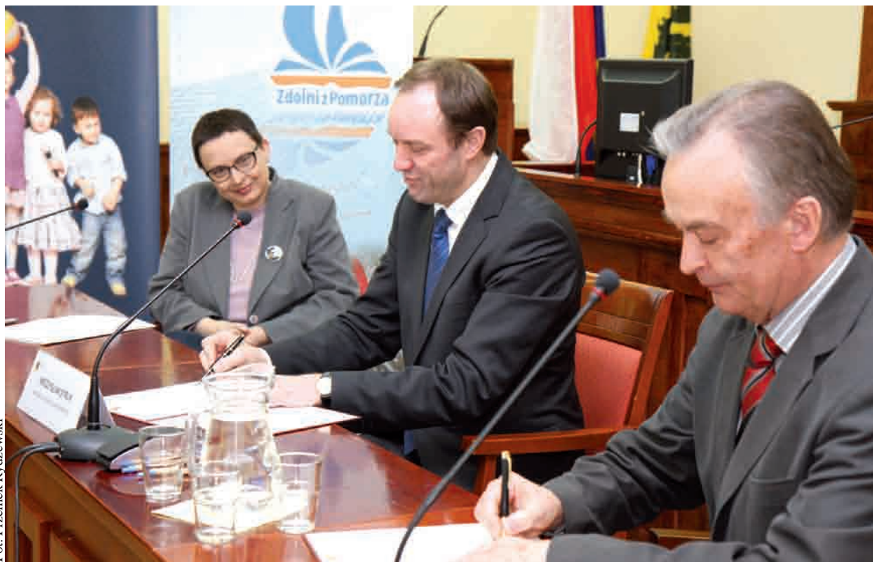
Podpisanie listów intencyjnych w sali Herbowej Urzędu Marszałkowskiego. Gościem była minister Edukacji Katarzyna Hall (z lewej)

Podpisanie listu intencyjnego to symboliczna inauguracja wspólnych działań, zmierzających do wypracowania regionalnego systemu wspierania uczniów uzdolnionych w ramach projektu „Pomorskie – dobry kurs na edukację - Wspieranie uczniów o szczególnych predyspozycjach w zakresie matematyki, fizyki i informatyki” (dla celów promocyjnych przyjęto nazwę „Zdolni z Pomorza”). realizowany jest od 1 września 2010 r. przez Departament Edukacji i Sportu UMWP. Już na samym wstępie założono, że najważniejsze dla powodzenia inicjatywy jest zaangażowanie jak największego kręgu instytucji, lokalnymi samorządami i uczelniami wyższymi, gdyż jedynie wspólne działanie daje gwarancje wypracowania nowoczesnych rozwiązań dla edukacji w regionie. Sygnatariuszami listów byli: miasta Gdańsk i Słupsk, powiaty: bytowski, człuchowski, kartuski, kwidziński, lęborski, malborski, starogardzki i wejherowski, a także Politechnika Gdańska, Uniwersytet Gdański nie zabrakło przedstawicieli przedsiębiorców z Pomor-