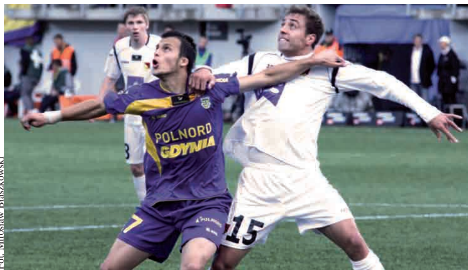
W rundzie jesiennej Arka pokonała na NSR Jagiellonię Białystok 1:0

Ten tydzień jest tak naprawdę pierwszym, w którym nowy trener ma możliwość spokojnego przygotowania zespołu do meczu ligowego. Przypomnijmy, bowiem, iż w zeszłym tygodniu Straka pierwsze zajęcia poprowadził dopiero w środę i nie miał za dużo czasu na przyjrzenie się grze zespołu. Stąd może, tak mało zmian w wyjściowej jedenastce w porównaniu z tym, co proponował Dariusz Pasieka. Choć kibice zapewne liczyli na 3 punkty w konfrontacji z Widzewem, to trzeba uczciwie powiedzieć, że to łodzianie byli bliżej kompletu oczek. Jak tylko się rozkręcili, to w samej końcówce pierwszej połowy mogli już zdobyć trzy gole. Na szczęście dla podopiecznych Franciszka Straki, albo nie potrafili wykorzystać idealnych sytuacji, jak np. Sernas, albo na drodze stawał Moretto. Arka niczym specjalnym nie zaskoczyła zawodników Czesława Michniewicza, bo i w kilka dni nowy opiekun żółto-niebieskich nie mógł wiele zdziałać. Na pierwszy rzut oka widać już, że jest świetnym