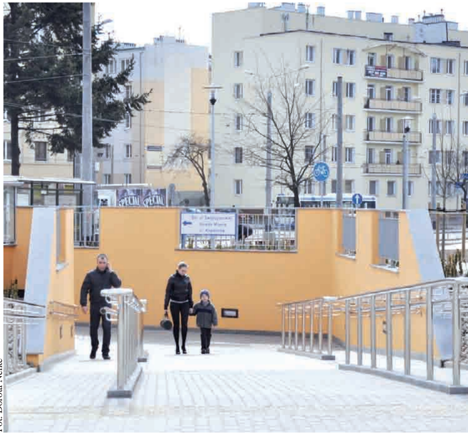
Przebudowa węzła zrealizowana została w iście ekspresowym tempie

W ramach inwestycji powstały: wiadukt kolejowy nad łącznicą Drogi Gdynskiej z ul. Władysława IV; wiadukt drogowy klasy wzduż wschodniej jezdni Drogi Gdynskiej; kładka pieszo - rowerowa w ciągu chodnika i ścieżki na ul. Władysława IV nad wyjazdem z tunelu; tunel dla pieszych pod ulicami Władysława IV i Świętojańską, na odcinku od przystanku kolejowego SKM Wzgórze Św. Maksymiliana do Skweru Plymouth.