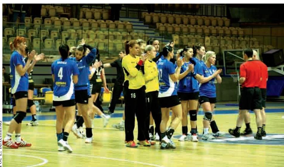
Oby po weekendzie zawodniczki Vistal Łączpola mogły bić sobie brawo

W ogóle cała pierwsza połowa w wykonaniu gdyńianek była fatalna. Nie dość, że nie potrafiły skutecznie wykonać akcji w ataku to jeszcze seryjnie traciły bramki. Na przerwę schodziły przegrywając 9:17. Kibice, którzy spodziewali się zmian po przerwie srodze się zawiedli. Gdyńianki nadal nie mogły złapać wiatru w żagle i tylko dzięki chwilowej niemocy przeciwnych podopiecznych Ciepłńskiego zniwelowały nieco stratę bramkową. Na nic to się jednak zdało, gdyż pewne swego lublinianki dowiozły zwycięstwo do końca spotkania, ostatecznie wygrywając 30:25. Ile może się zmienić w ciągu jednej doby? To pokazał niedzielny rewanż drugiego z trzecim zespołu sezonu zasadniczego. Można nawet po-