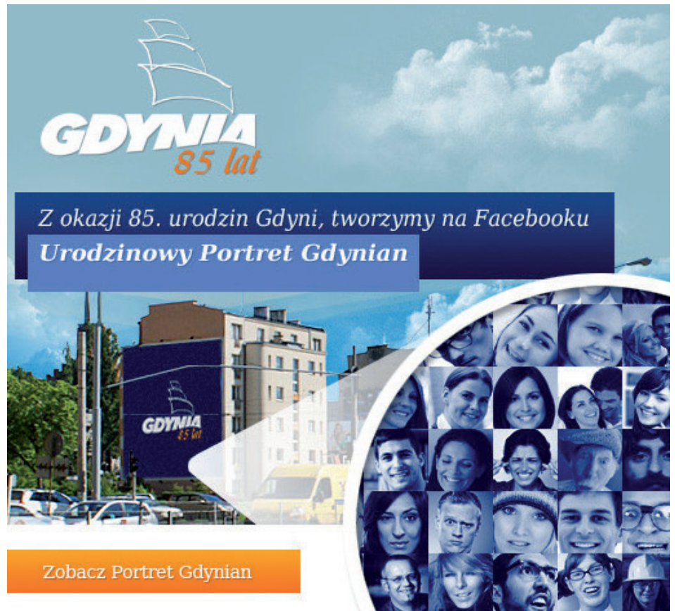
Urodzinowy Portret Gdynian z przestrzeni wirtualnej trafi do miejskiej w centrum Gdyni

- Gdynia pomimo 85 lat w niczym nie przypomina leciwej staruszki, wręcz przeciwnie z każdym rokiem wygląda pięknie, młodziej. Prawdopodobnie dzieje się tak za sprawą cudownych jej mieszkańców :) Wszystkiego co najlepsze Kochana Gdynio. (ANGO)