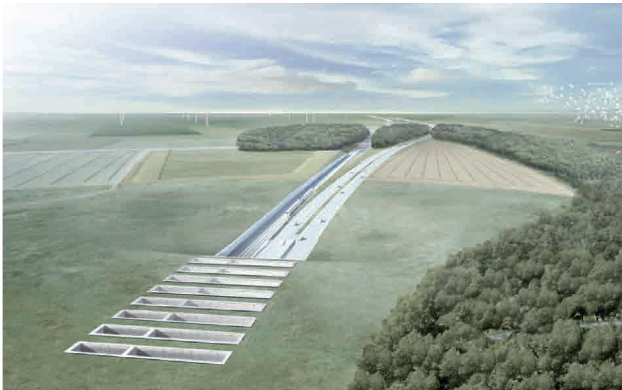
Wizualizacje tunelu: www.femern.com