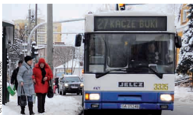
Zmiany dotyczą również trolejbusów linii 27

Większe uprawnienia w walce z gapowiczami zyskali także kontrolerzy biletów. Będą oni mogli teraz zatrzymać taką osobę w pojeździe, przytrzymać za rękę lub w razie konieczności... gonić do chwili przybycia policji. Do tej pory kontrolerzy nie mieli prawa nawet dotknąć gapowicza. Co ciekawe prawo do obywatelskiego zatrzymania osoby bez biletu zyskali także współpasażerowie. SKM i PKP także inaczej