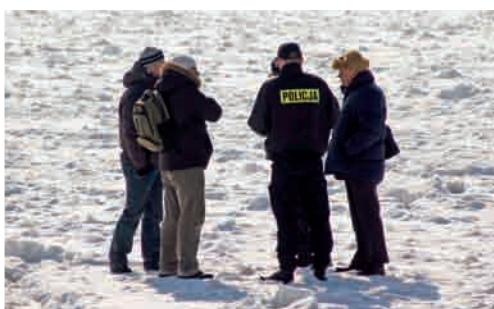
Policja legitymuje spacerowiczów po lodzie