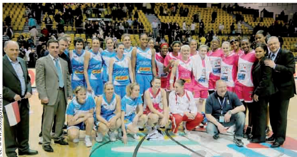
Gwiazdy zeszłorocznej edycji All Star Game